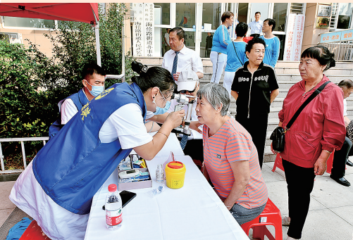
■山东第一医科大学附属青岛眼科医院志愿者为居民义诊。