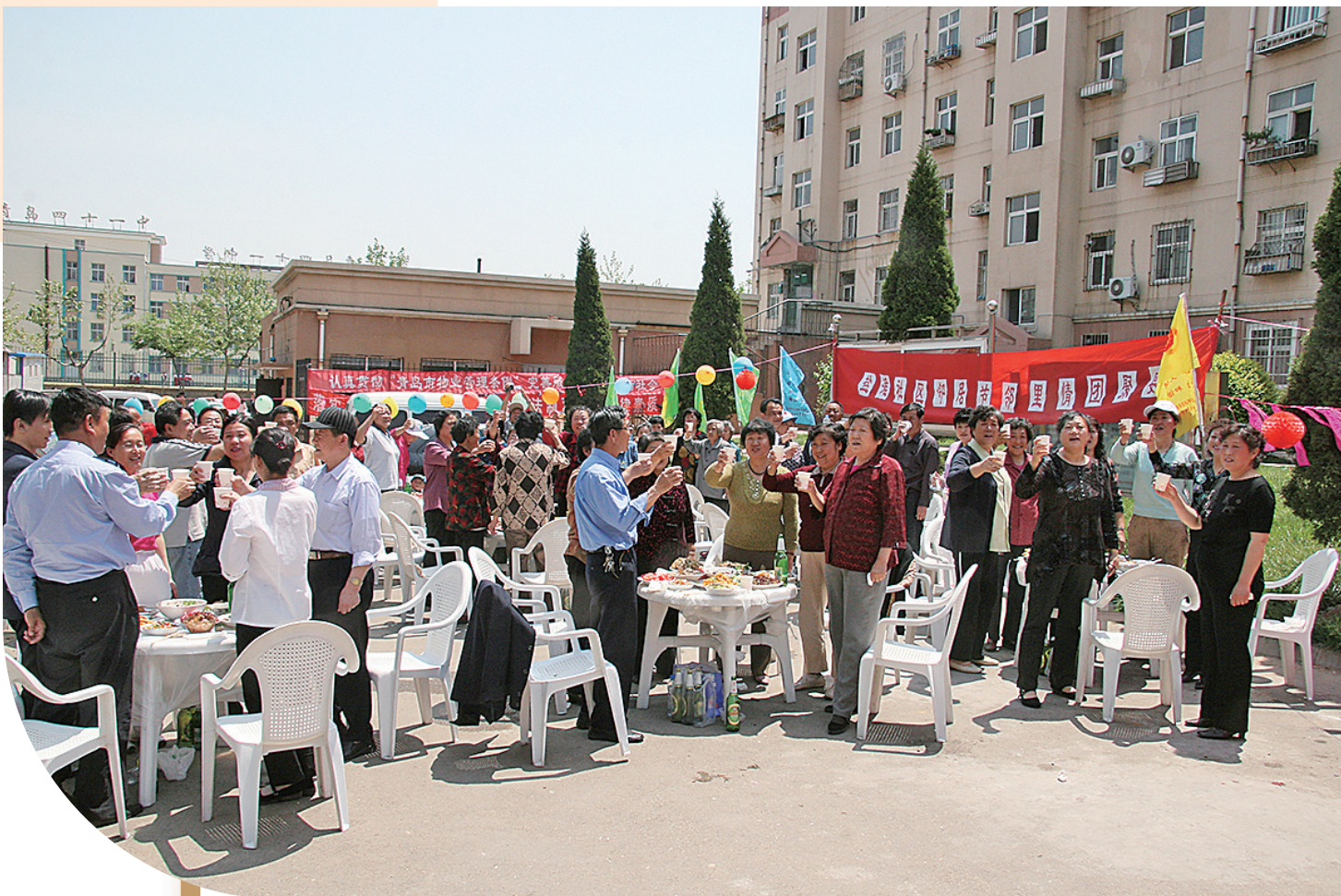
■2007年邻居节,盐滩社区居民齐聚一堂共叙邻里情。