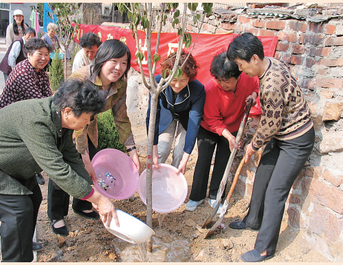
■第一届邻居节期间,邻居们共同种下“和谐树”。