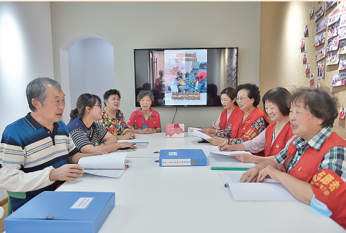
■延安路街道延安一路社区第五网格党支部听取居民代表对基层治理工作的意见。