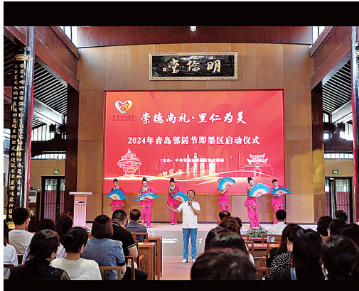
■邻里节启动仪式上的歌舞表演。