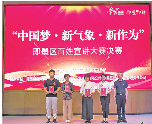
■获奖选手上台领奖。