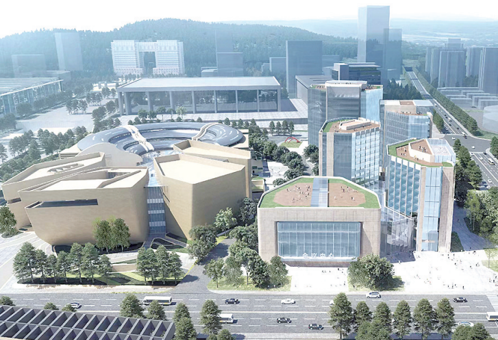
■ 青岛财富金融综合创新中心项目效果图。

区属国企规模持续做优做大。文化旅游是崂山区四大主导产业之一,当前,崂山区锚定“打造崂山传统文化传承创新片区”“世界级旅游景区”两大目标全力奋进,崂山旅游集团作为崂山旅游发展的战略平台,正聚焦主业奋力开拓。“集