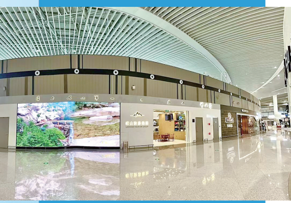
■ 胶东国际机场崂山旅游体验店。