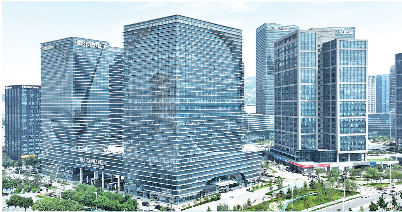
■ 青岛国际创新园高新技术企业集聚。

青岛是第二批区域性国资国企综合改革试点城市,国企改革一直走在全国前列。作为全市发展的重要增长极,崂山区在新一轮国企改革中下好先手棋,围绕改革的重点实施深化提升行动,持续推进重点领域战略性重组和专业化整合,优化国有企业产业布局,在保持主业合理规模的基础上,匹配区域发展战略、服务区域实业发展,为区域经济高质量发展澎湃新动能、打开新空间。