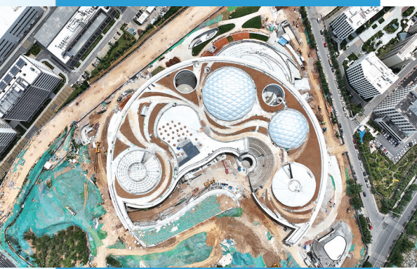
■ 即将交付的青岛虚拟现实创新中心。