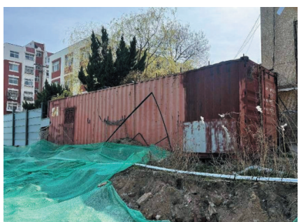
青岛市体育产业发展中心 2024年6月18日