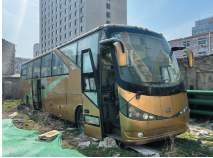
青岛市体育产业发展中心 2024年6月18日