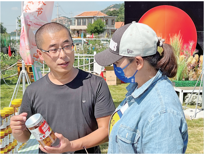
■崂山商户向消费者推介樱桃产品。

着力乡村面貌，让乡村治理有了新效能。乡村治理水平直接关系到农民的获得感、幸福感。崂山区聚焦优环境、提质效，持续优化乡村生态，投入资金近50亿元，统筹实施供水、强弱电、燃气、道路等农村公共基础设施建设，同时紧抓改厕、垃圾和污水等重点任务，深入开展农村人居环境整治“回头看”，实施村容