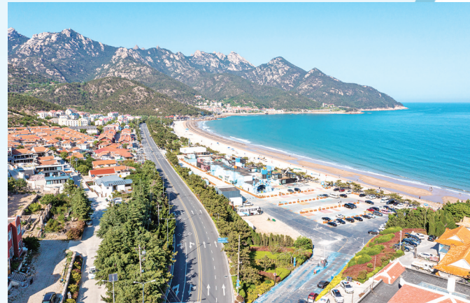
■沙子口街道流清湾乡村振兴示范区依山傍海。