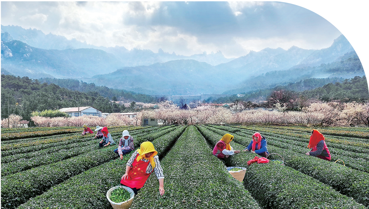
■崂山茶农在茶园采摘茶叶。