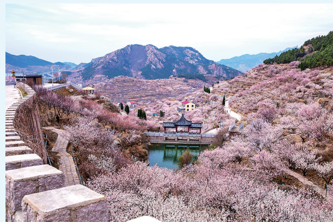
■北宅街道大崂樱桃谷樱花美不胜收。（资料照片）

春耕夏耘，秋收冬藏。建区30载，更迭的是农村日新月异的发展图景，不变的是对“三农”工作的坚守与创新。在山海之间，一幅农业高质高效、乡村宜居宜业、农民富裕富足的崂山版“富春山居图”徐徐铺展开来。