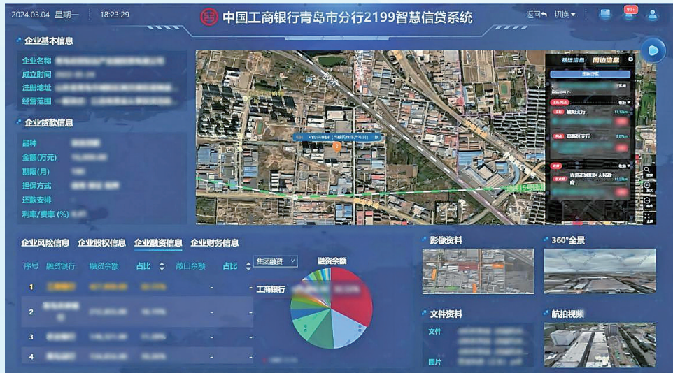
■青岛工行自主创新研发的“2199 智慧信贷系统”。

围绕新质生产力和数字化转型,“智能化”和“平台化”发展成为工商银行金融科技发展的重要标签。