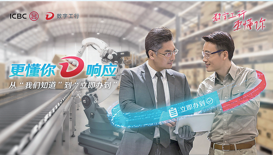
■青岛工行以“数字金融+”助力“新制造”。

青岛,正加大力度推进新型工业化,加快建设先进制造业强市,在增长方式、功能定位等更多维度谋求新突破,如何发挥好金融业“加速器”“润滑剂”作用,点燃赋能强引