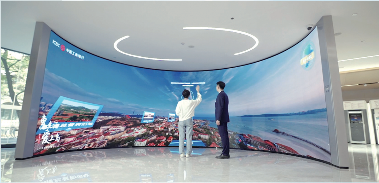
■青岛工行倾力打造智慧网点。

青岛工行作为中国工商银行总行确定的八家数字化转型示范行之一,紧抓数字经济时代新机遇,始终坚持“科技引领、价值创造”的工作思路,紧跟总行“数字工行(D-ICBC)”建设步伐,深耕不辍,初步探索出“系统内有亮点、同业有竞争力、具有青岛特色”的数字工行建设路径,进而实现内部管理效率和对外服务水平的双提升,用实干之笔,奋力谋篇精彩的数字金融大文章。