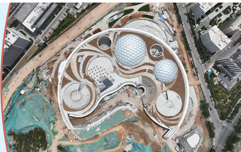
■即将交付的青岛虚拟现实创新中心。

进入2024年，站上建区30周年的全新起点，崂山区锚定市委赋予的“打头阵、蹚新路”使命任务，全领域有机更新、点对点攻坚突破，聚力在城市更新和精建精管上提质争先，坚持既雕好“面子”，又琢好“里子”，以现代化理念、国际化视野优化城市空间、功能配套、人居环境，努力让城市更宜居、群众生活更幸福。