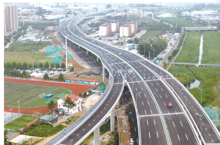
■跨海大桥高架路二期。