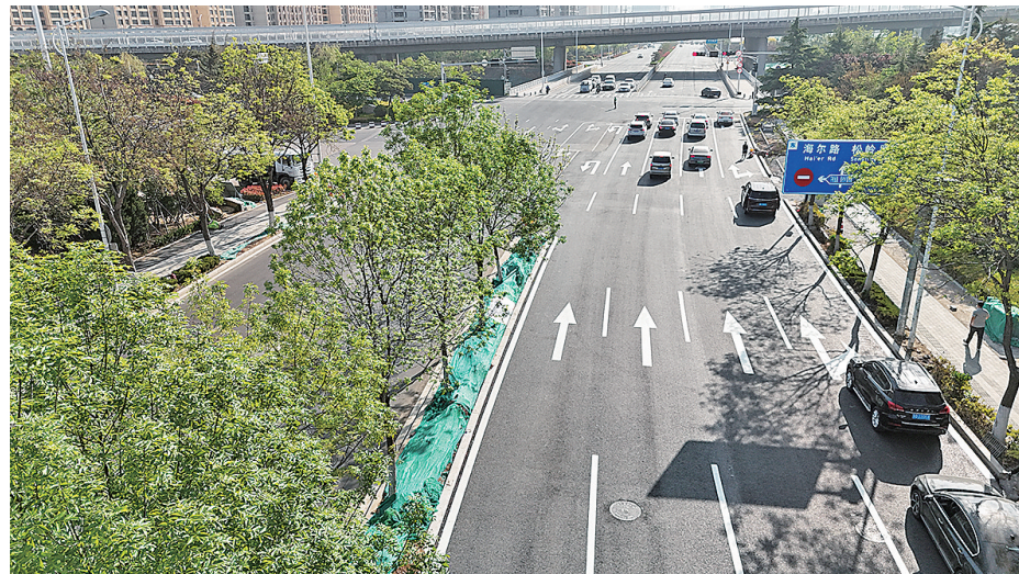
■株洲路张村河（劲松五路）焕新归来。