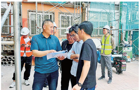
■台东一路61号小区改造，充分听取居民意见。图为街道相关负责人督查落实改造情况。