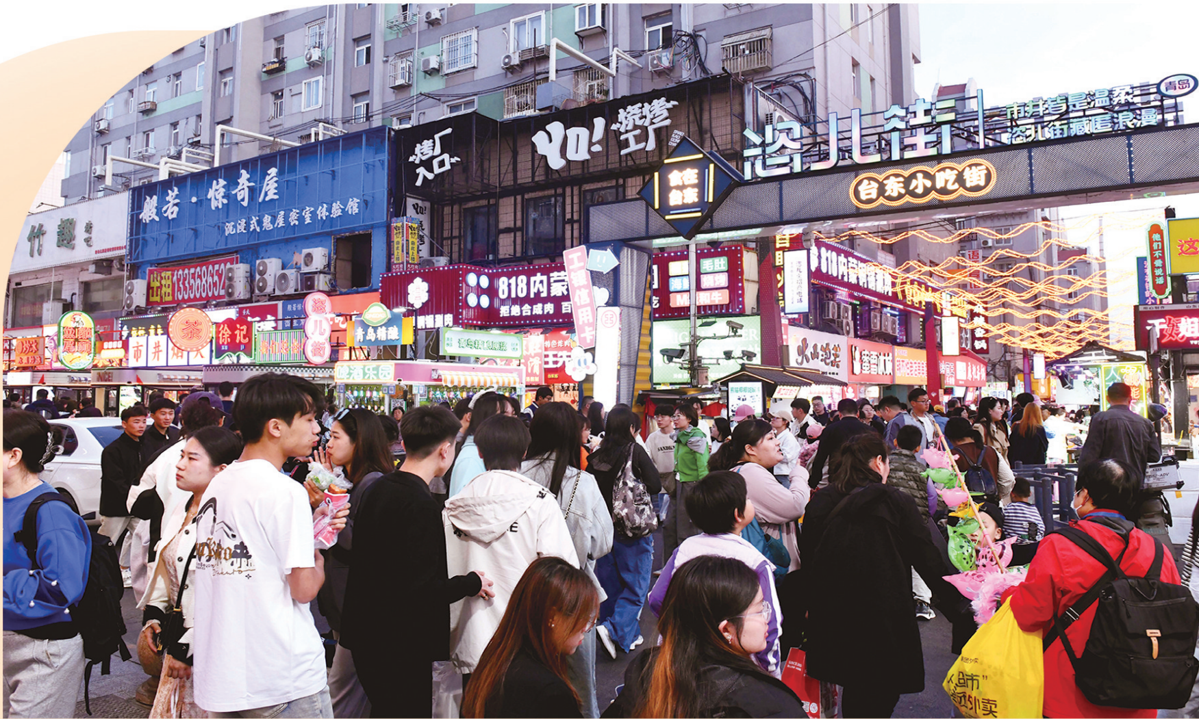
■精细化管理让台东三路步行街人气居高不下。

今年以来，市北区台东街道强创新、抓治理、提能力，通过联合“双联盟”单位共治化解商居纠纷、探索楼院“自管会”拓展社区治理新路径等措施，让“民声”传递高效，把“民意”落在实处，提升群众幸福指数。