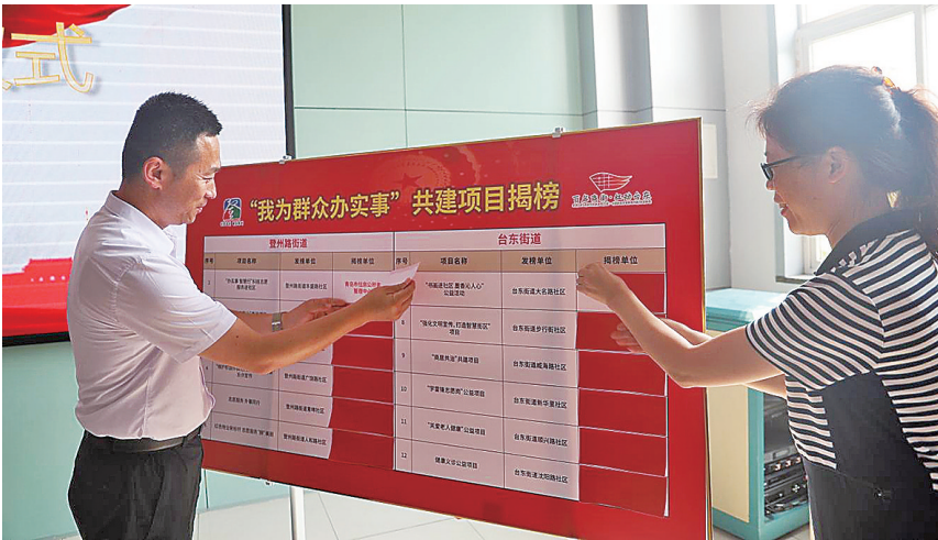
■“双联盟”单位认领民生服务项目。

针对辖区环境提升，台东街道常态化开展“人人动手 洁净家园”环境卫生集中清理行动。街道、社区、公益岗、志愿者拧成一股绳，“拉网式”集中清理卫生死角、乱堆乱放，全力营造整洁靓丽的街区环境。