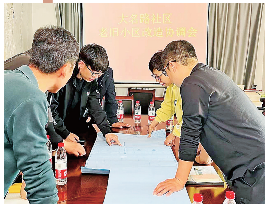
■大名路社区召开老旧小区改造协调会。