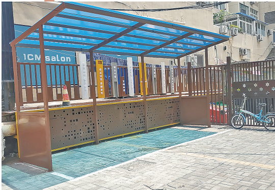
■大成路47号楼院改造后焕然一新，新铺装了地面，安装了停车棚。