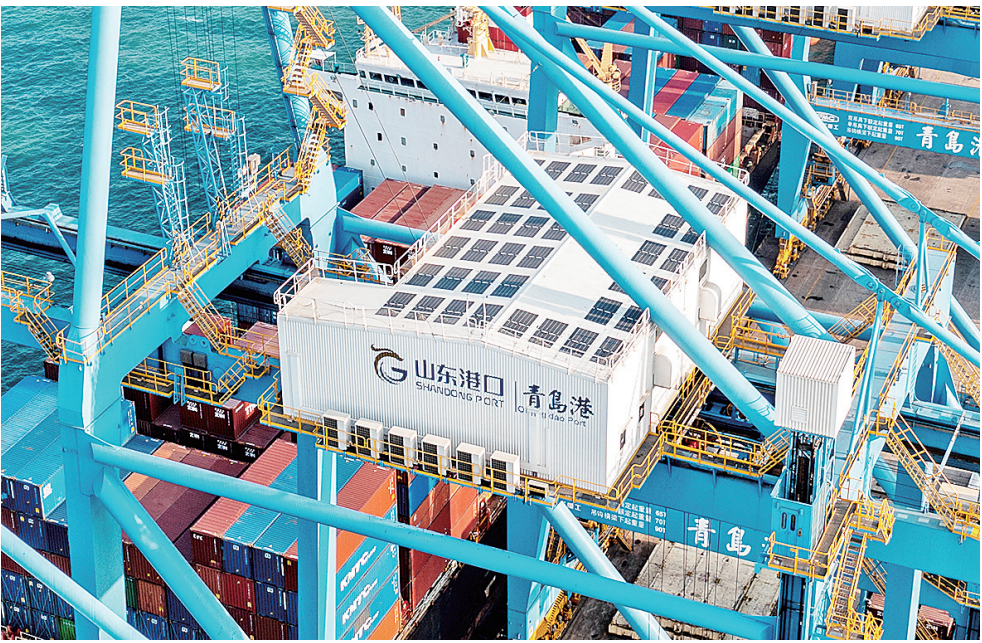
■山东港口青岛港自动化码头推动分布式光伏、风电等新能源应用。

谈及绿色港口建设,首先要明确一点:港口的绿色转型不是单一方面的孤军奋战,而是与整个航运业息息相关,需要“港口+航运”共同发力。 航运业承载着全球80%以上的贸易量,历来是排放大户。去年7月,国际海事组织通过重新修订的船舶温室气体减排战略,明确国际海运温室气体排放尽快达峰,并考虑到不同国情,在2050年前后达到净零排放的远期目标。更为紧迫的是,欧盟将航运业纳入欧盟碳排放交易体系,分阶段就船舶排放征收费用。 可以看到一个明显趋势——从今年开始,包括港口、船公司、造船企业、能源供应商在内的港航产业链,都开始加速绿色低碳转型。 截至今年4月份,全球使用清洁绿色能源动力的船舶数量已经达到1800多艘,整个一季度新造船订单中清洁能源的比例达到46.7%,与此同时租赁船用清洁燃料生产储运加注产业