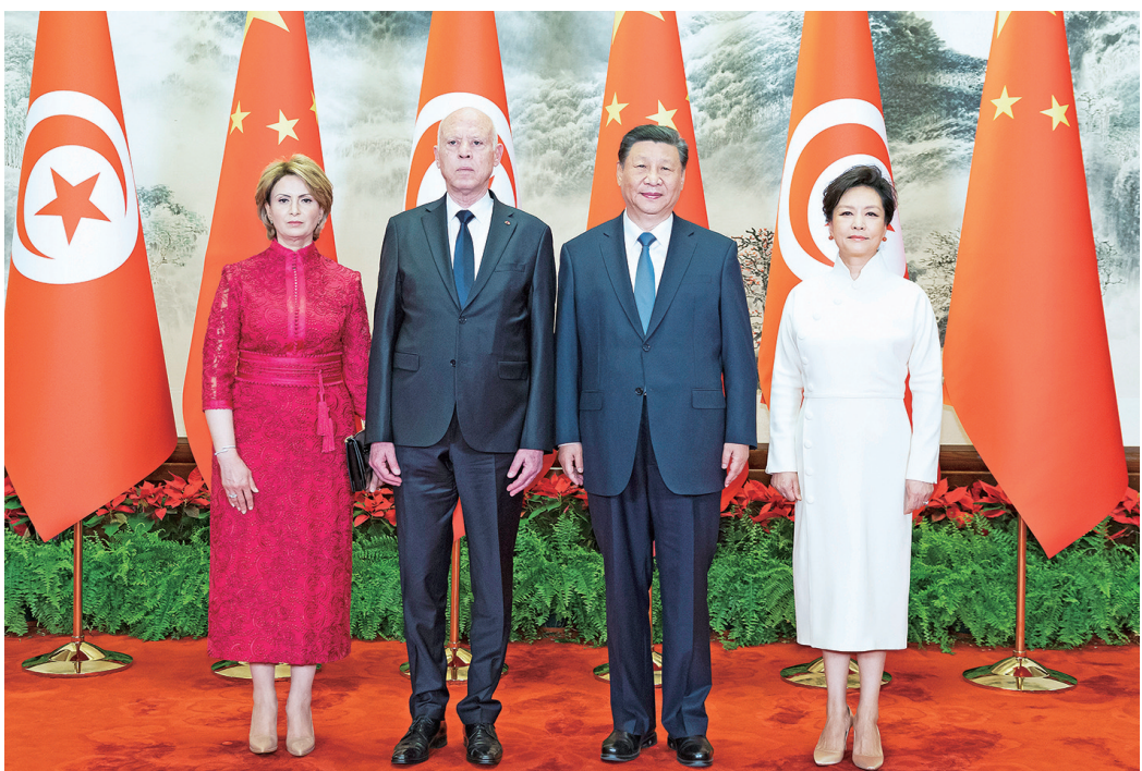
5月31日上午,国家主席习近平在北京人民大会堂同来华国事访问并出席中国-阿拉伯国家合作论坛第十届部长级会议开幕式的突尼斯总统赛义德举行会谈。这是会谈前,习近平和夫人彭丽媛同赛义德和夫人伊什拉美合影。