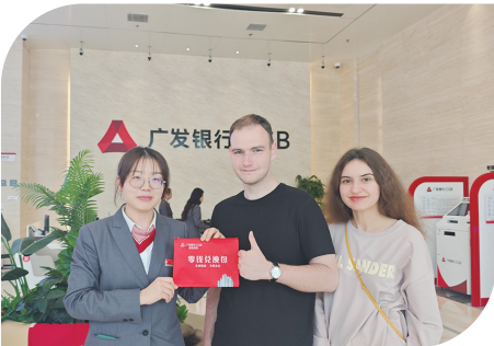
■工作人员向留学生发放零钱兑换包。

高政治站位,统一认识,抓好任务落实,持续加强优化支付、服务提升支付便利性,以满足老年银发族、外籍在华人士的需求与体验,为营造稳定、和谐、开放的金融环境贡献广发力量。