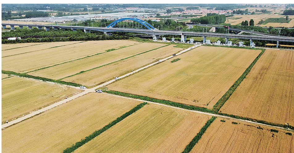
时下的青岛西海岸新区大场镇绿色增粮先行示范区小麦基地麦浪翻滚,丰收在望。

乡村振兴齐鲁样板先行区。2023年,全市粮食生产实现面积、总产、单产“三增”,粮食和重要农产品稳产保供能力在全国36个大城市中持续领先。全市农村居民人均可支配收入达到29736元,同比增长7.3%,增速高于城镇居民2.2个百分点。