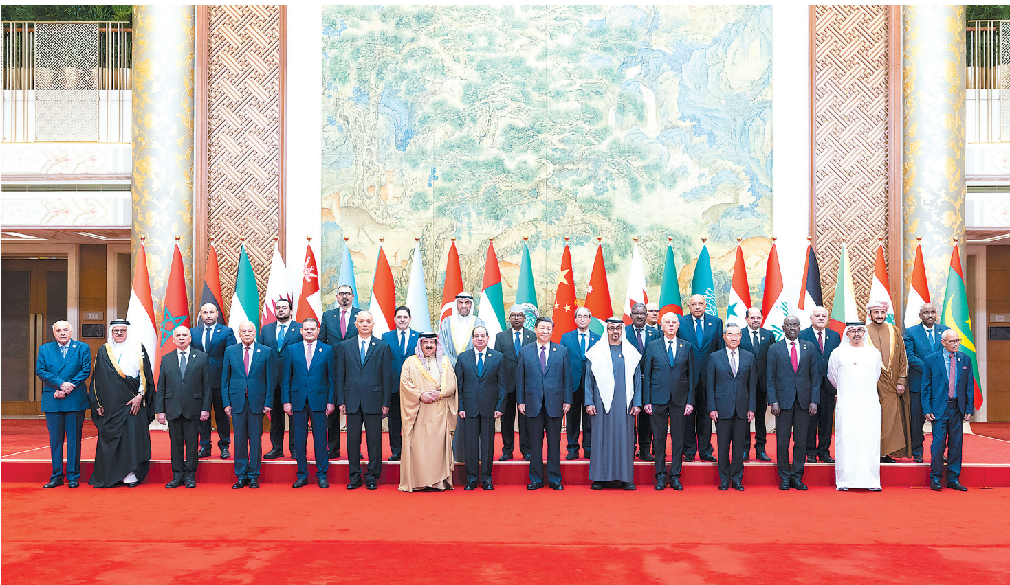
5月30日上午,国家主席习近平在北京钓鱼台国宾馆出席中阿合作论坛第十届部长级会议开幕式并发表主旨讲话。这是习近平同巴林国王哈马德、埃及总统塞西、突尼斯总统赛义德、阿联酋总统穆罕默德、阿盟秘书长盖特以及22位阿拉伯国家代表团团长集体合影。

新华社北京5月30日电(记者马卓言 曹轶)5月30日上午,国家主席习近平在北京钓鱼台国宾馆出席中阿合作论坛第十届部长级会议开幕式并发表主旨讲话。习近平宣布,中方将于2026年在中国举办第二届中阿峰会,中方愿同阿方弘扬中阿友好精神,构建“五大合作格局”,推动中阿命运共同体建设跑出加速度。