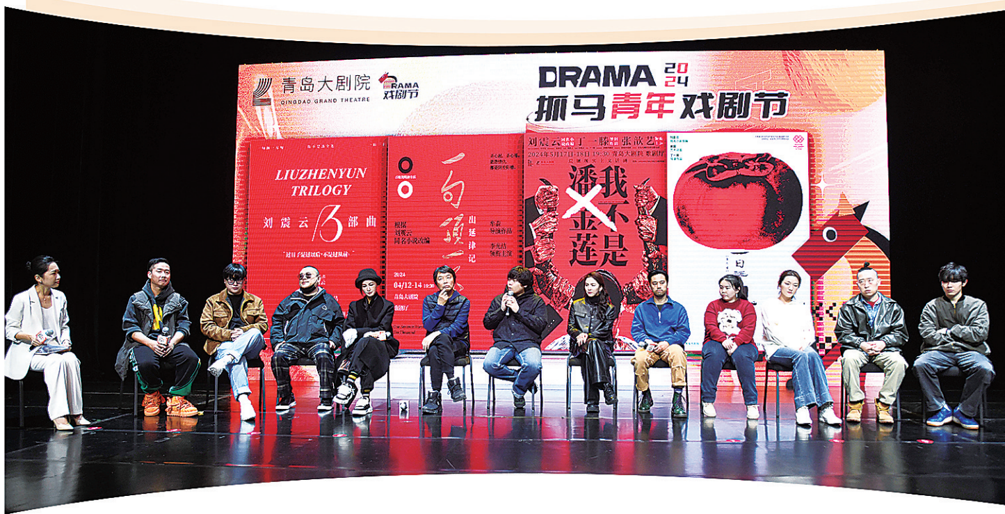
■刘震云舞台三部曲《一日三秋》《一句顶一万句》《我不是潘金莲》正在全国各大剧院巡演。