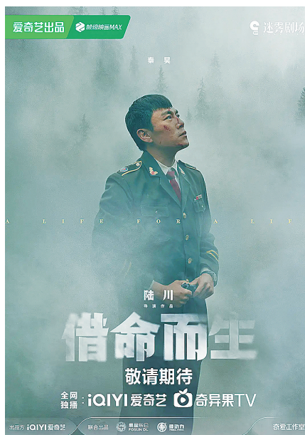
■《借命而生》的原著作者是鲁迅文学奖得主石一枫。

在影视改编过程中，个性化文本的转化也有特殊困难。像是《一句顶一万句》被誉为茅奖历史上最佳小说之一，刘震云独创了“A是B，也不是B，是C，又不是C，其实是D”的缠绕句式，在文本层面深刻揭示了沟通之难、语言之无力，然而《一句顶一万句》由他女儿刘雨霖拍成电影后并未取得预期反响，反倒是文学价值相形见绌的《我不是潘金莲》被冯小刚改编后反响不错。另一方面，女性主题文学作品近年来备受文学界重视，然而女性文学的影视改编热度不高。业内人士表示，女性视角的影视改编在国内有两座大山，首先是海外改编剧的