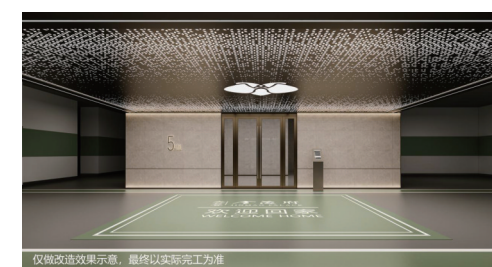
▲大云谷·金茂府地下停车场改造效果图