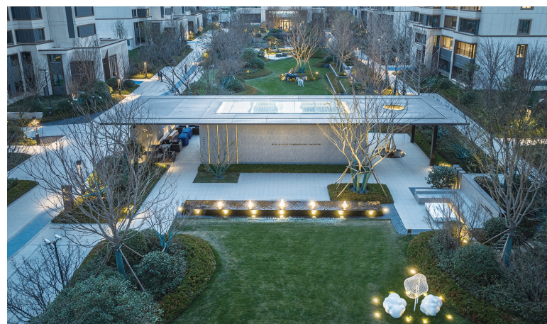
▲大云谷·金茂府已交付地块实景图