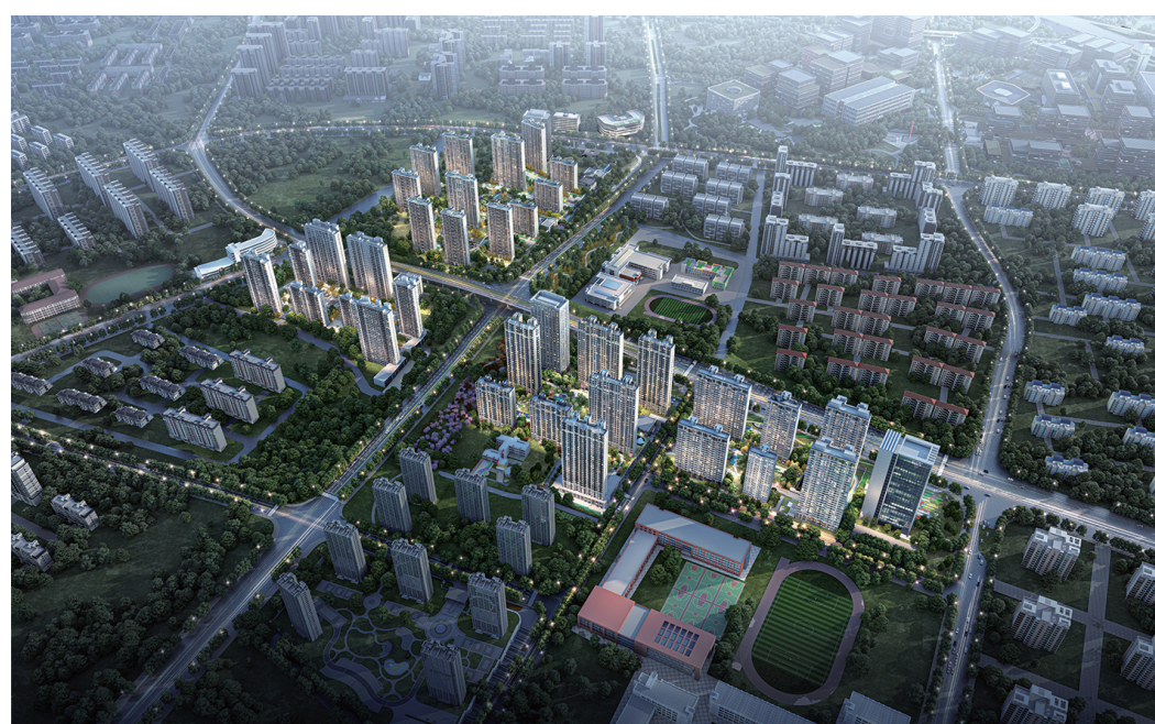
▲大云谷·金茂府项目鸟瞰效果图

近日,中高端楼盘扎堆的浮山后板块再次掀起一股品质锤炼的新热潮。大云谷·金茂府率先针对已交付地块提出一揽子升级改造计划,引发市场和众多置业者的讨论和热议,将浮山后居住品质再次提升到一个全新高度。