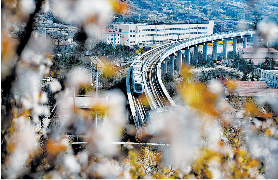
■青岛地铁11号线穿越“花海”。