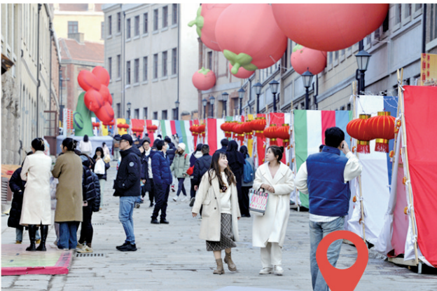
■游人漫步黄岛路感受现代美学和老街里的视觉冲击。

此外，中山路上的昔日地标商厦也开始扎堆焕新。今年2月，百盛购物中心裙楼及地下车库改造提升项目启动，这座曾经的地标商业体将转型为首店、潮牌集聚的上街里MALL。华能大厦音乐家广场项目有序推进，其一层、二层将引入具有海洋文化属性、青岛特色的业态，以及网红咖啡店、星巴克、必胜客等餐饮品牌。东方贸易大厦也将启动更新，打造餐饮、酒店、文化艺术厅以及潮流商业集合空间。