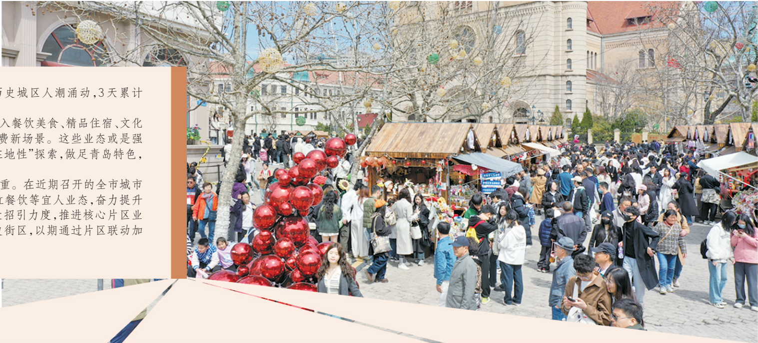
■刚刚过去的清明假期，青岛历史城区人潮涌动。

如何进一步激发消费新活力，推动青岛历史城区实现“长红”？业态依然是重中之重。在近期召开的全市城市更新和城市建设2024年度动员大会上，青岛历史城区列出新目标——将积极布局网红餐饮等宜人业态，奋力提升全域业态运营率，推动新增业态面积不少于10万平方米。为此，青岛历史城区正加大招引力度，推进核心片区业态落位；加大复制、推广更新经验，把更新范围拓展延伸至无棣路、信号山、苏州路历史街区，以期通过片区联动加速历史城区“破茧成蝶”。