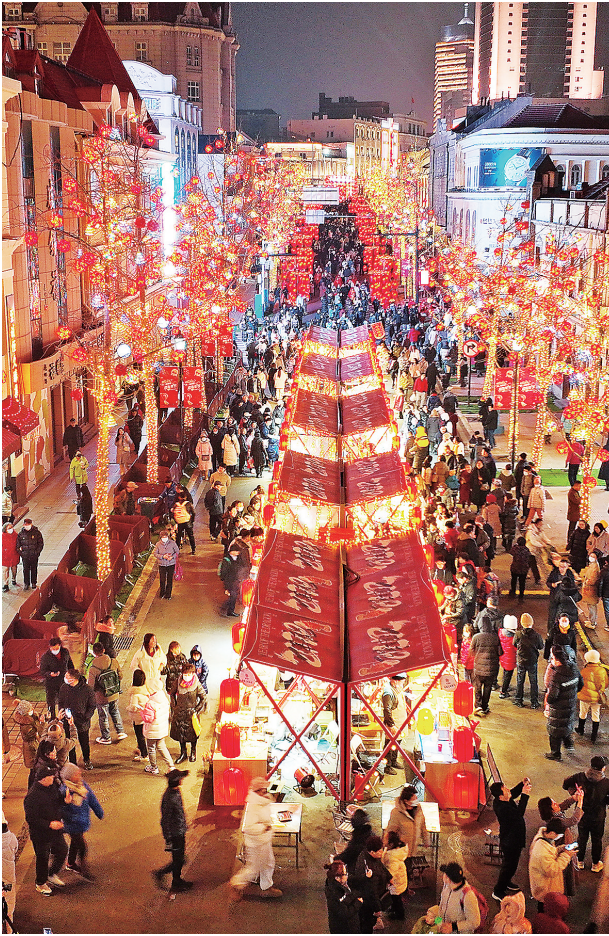
■“焕新”后的青岛历史城区吸引全国各地游客打卡。