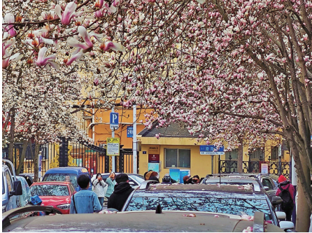
■市南区澄海路上的玉兰花盛开。

春和景明，万物复苏。市南区抢抓春日出游热点时段，整合区域内海洋、文旅、康养、花海等特色资源，提升全域旅游品质，拓展更多文旅活动，打造舒适消费场景，推动文旅资源互融、主客共享、企业共赢，焕发“春日经济”的勃勃生机。