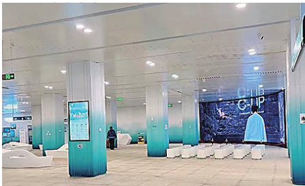
■市南区文旅康养综合服务中心投入运营。