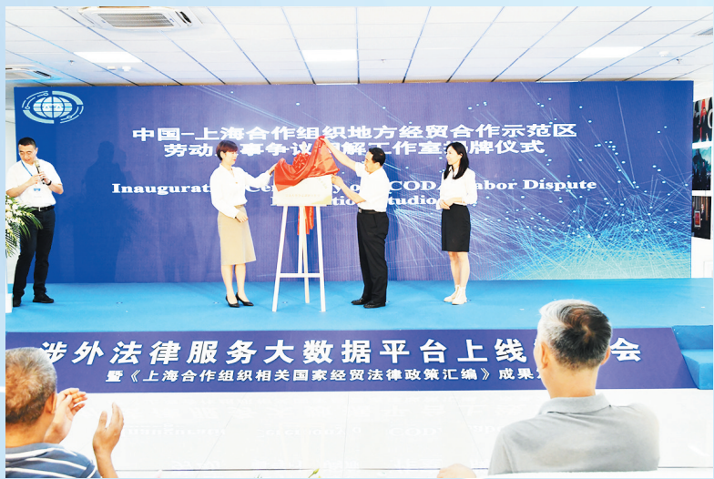
■上合法务区打造的一站式国际商事纠纷解决平台——上合劳动争议调解工作室揭牌。