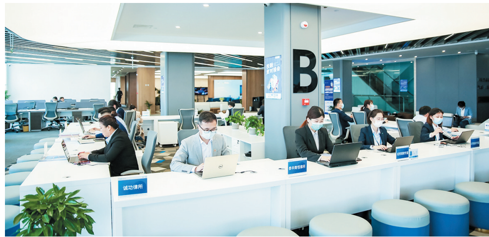
■自贸法务区法律会客厅。