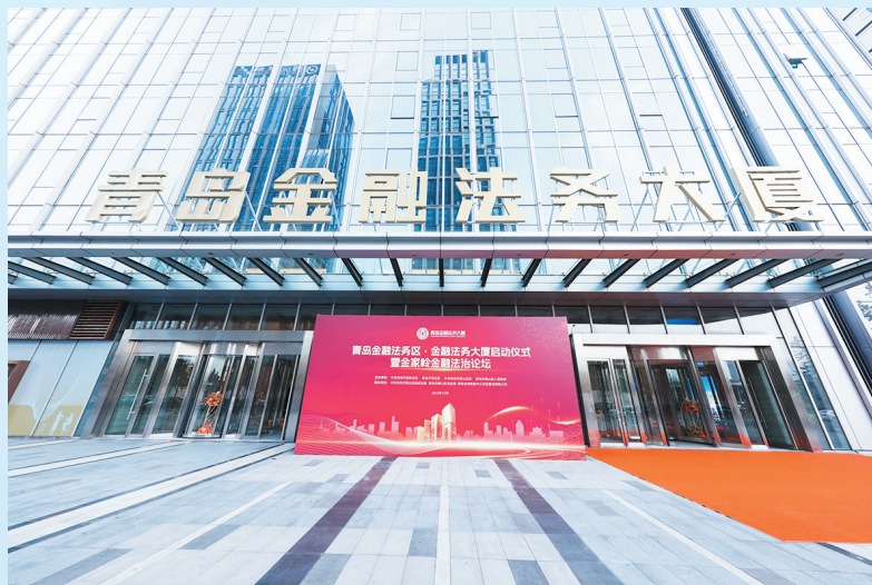
■青岛金融法务大厦外景。