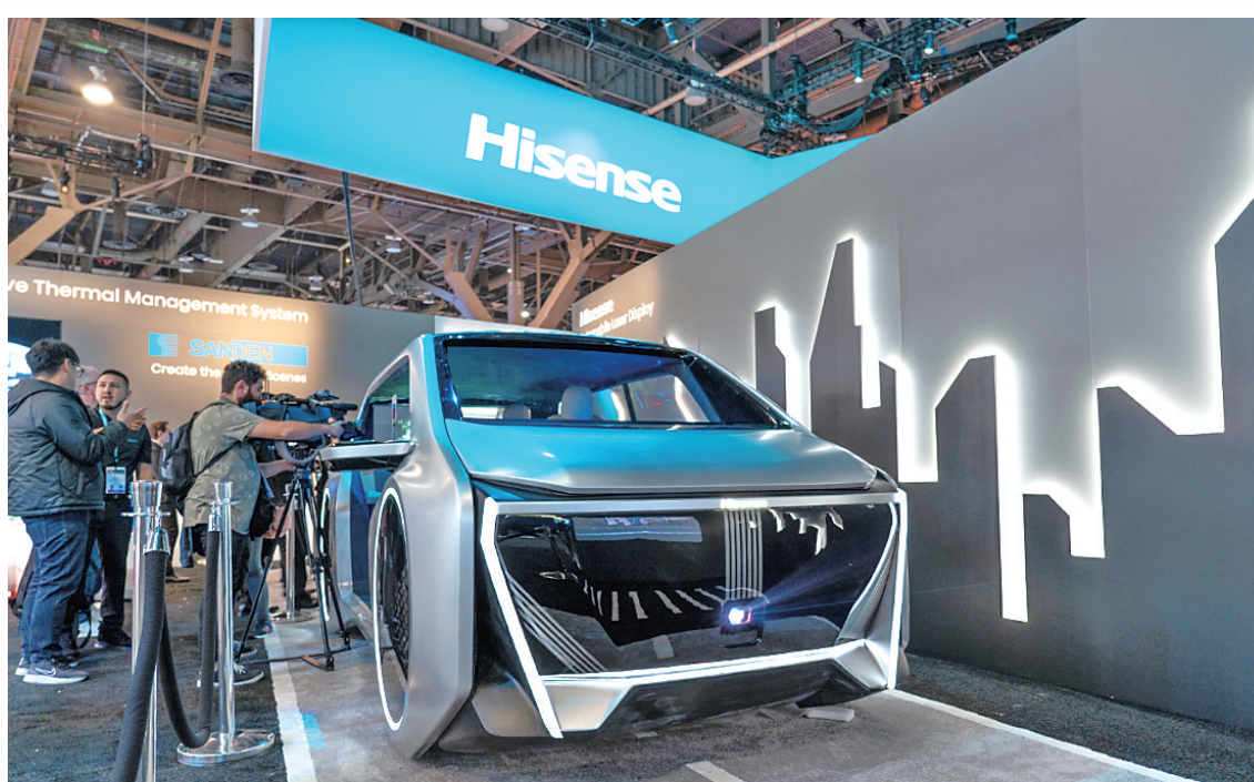
■海信在2024CES上展示的车载显示方案吸引观众关注。

规模以上工业企业数量突破 5000 家，新增省级制造业领航培育企业 5 家以上、省级以上制造业单项冠军 10 家以上、专精特新中小企业 300 家以上