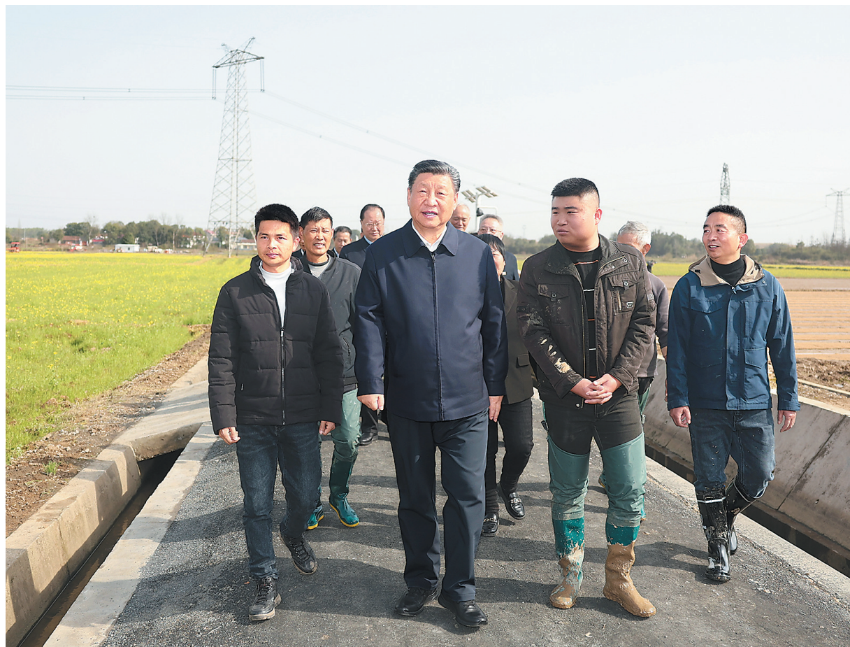
3月18日至21日,中共中央总书记、国家主席、中央军委主席习近平在湖南考察。这是19日下午,习近平在常德市鼎城区谢家铺镇港中坪村,同种粮大户、农技人员、基层干部亲切交流。

新华社长沙3月21日电 中共中央总书记、国家主席、中央军委主席习近平近日在湖南考察时强调,湖南要牢牢把握自身在构建新发展格局中的战略定位,坚持稳中求进工作总基调,坚持高质量发展不动摇,坚持改革创新、求真务实,在打造国家重要先进制造业高地、具有核心竞争力的科技创新高地、内陆地区改革开放高地上持续用力,在推动中部地区崛起和长江经济带发展中奋勇争先,奋力谱写中国式现代化湖南篇章。