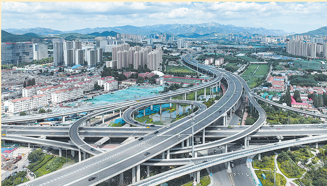
■青岛城市快速路网逐渐成环成网。