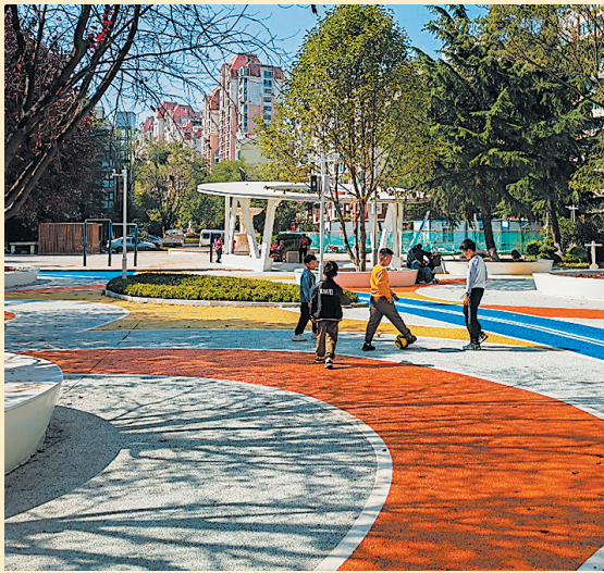
■孩子们在修葺一新的崂山区世纪华庭小区内玩耍。

着眼今年，还会有更多民生工程、民心工程擦亮“人民城市”的底色，将充分利用城区边角地、立交桥桥下空间等，建设140个口袋公园；加快李村河（张村河）、白沙河流域综合整治，全面提升