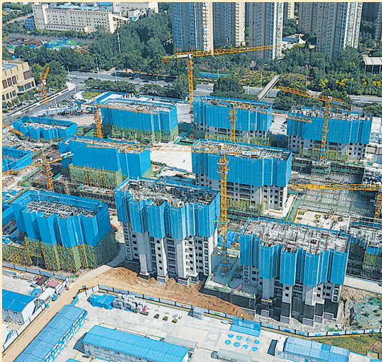
■李家庄社区村庄改造安置区项目正在加速建设。