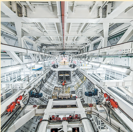
■胶州湾第二隧道正在有序掘进中。