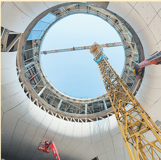
■青岛虚拟现实创享中心项目现场一派繁忙。