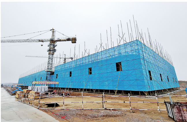
融安光电科技园加快建设。

接，用最优的服务、最高的效率、最诚的心意，保障项目快速落地。“成立工作专班后，团队全程靠上，为项目方提供精准服务，对企业注册流程进行全面梳理，并且倒排时间表、路线图，和相关部门协作，压茬推进手续办理。”工作人员