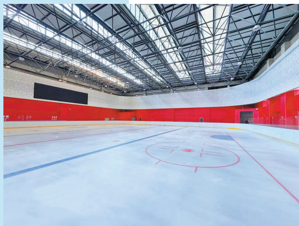
■学校建有真冰冰球场。