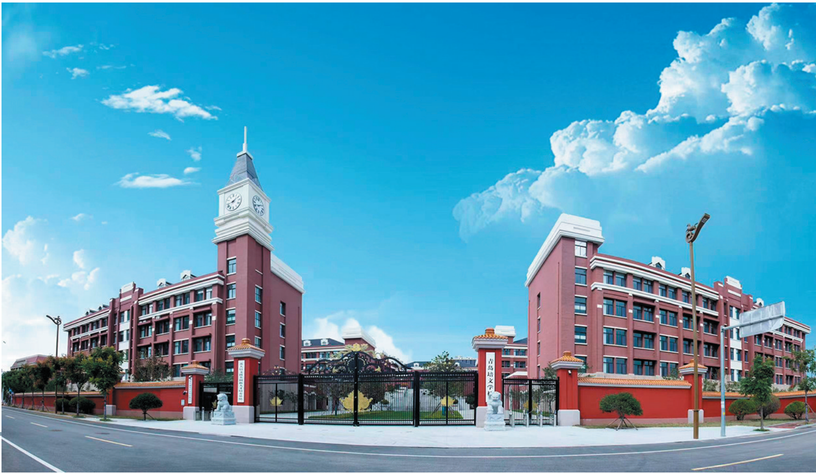
■青岛培文学校外景。

办好一所学校，幸福千万家庭。作为青岛教育版图上的新生力量，青岛培文学校为学生打开多元化发展之门，在学科培优、实验探索、美育、体育等方面追求特色发展，秉持“关注每一位学生，使弱者变优，优者更优”的理念，助力学子圆梦理想大学。