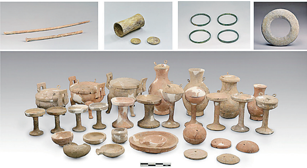
■三埠李家遗址中发掘的战国墓葬随葬品。

三埠李家遗址位于青岛市平度新河镇三埠李家村东北方向,坐落于一处低矮丘陵的北麓,临靠淄阳河,近河近海,位置极佳。青岛市文物保护考古研究所副所长尹锋超介绍,三埠李家遗址文蕴深厚,考古发掘历时三年,工作人员扎根田野、栉风沐雨,完成全部五项考古发掘任务,发掘面积达15500平方米,出土文物上千件(套),取得丰硕成果,许多是青岛乃至山东地区首次发现。