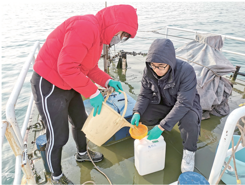
海洋所工作人员在胶州湾开展海水取样工作。

几十年来,几代科研工作对胶州湾浮游植物开展了长期而系统的调查研究,获得了大量的研究成果。以往文献在胶州湾共报道了549种浮游植物。但是由于以前基于浮游植物形态特征的物种鉴定方法不能有效区分形态相