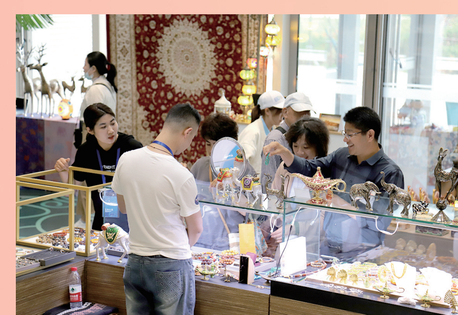
■2023上合国际经济贸易博览会上，精美展品吸引了参观者的目光。

多措并举促增收。 胶州市创新“乡村公共资源+共富公司”机制，成立镇村级共富公司57家，实现增收8700万元。