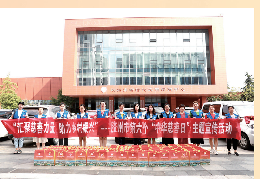
■胶州市慈善总会开展主题宣传活动。