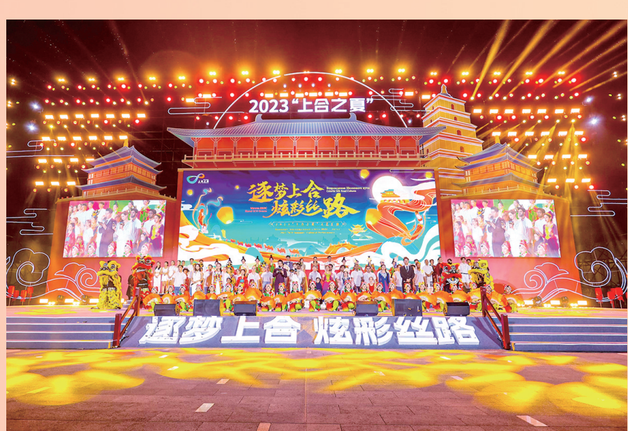
■2023“上合之夏”成为上合示范区商旅文化交流的“主打”品牌活动。