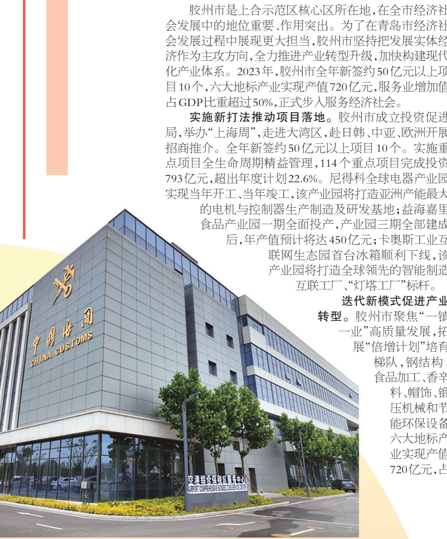
■空港综合保税区服务中心。