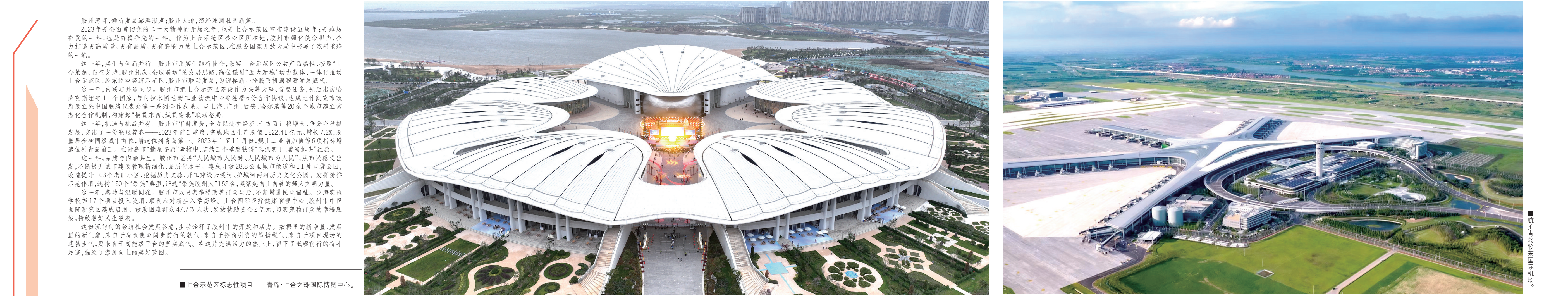
■上合示范区标志性项目——青岛·上合之珠国际博览中心。