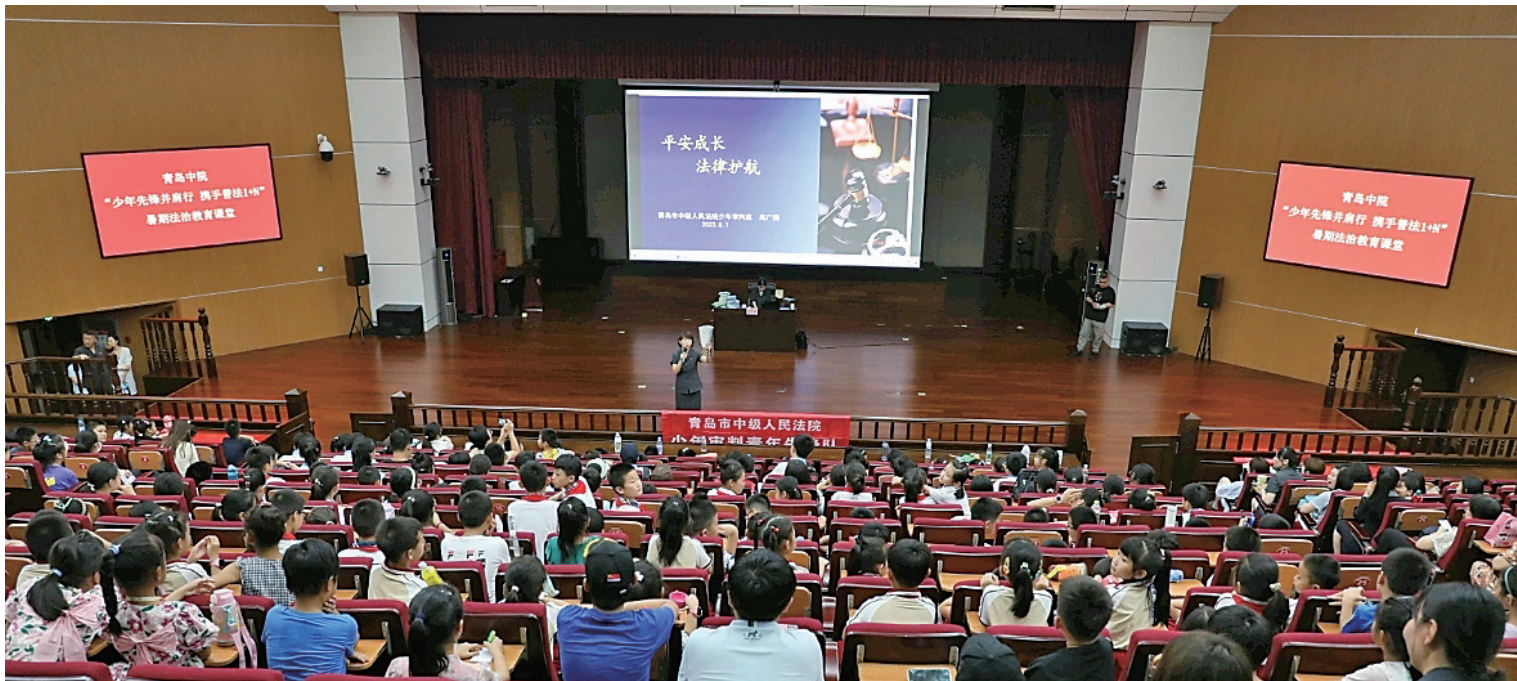
■青岛中院举行“少年先锋并肩行 携手普法1+N”系列活动。

2023年是全面贯彻落实党的二十大精神开局之年。在市委坚强领导和市人大及其常委会有力监督下，在市政府、市政协及社会各界关心支持下，青岛两级法院坚持以习近平新时代中国特色社会主义思想为指导，全面贯彻党的二十大精神，深入贯彻落实习近平法治思想和习近平总书记对山东、对青岛工作的重要指示要求，忠实履行宪法法律赋予的职责，能动服务打头阵、当先锋，各项工作取得新发展。全市法院受理案件35.8万件，办结35万件，均居全省法院首位；市中院受理案件3.1万件，办结3.1万件，均居全省中院首位。全市法院共有102个集体、170名个人获市级以上表彰，77项经验做法、225件典型案例在全国和省、市推广，涌现出“全国法院先进集体”中院环资庭，“全国优秀法官”齐新，“全省最美女法官”纪晓昕、王晓晖等先进典型。