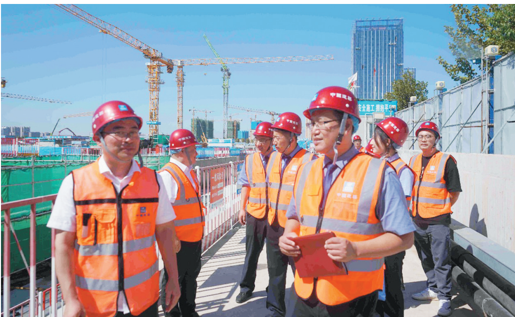
■胶州市检察院检察官走进中建八局上合广场项目工地和项目部，与该公司相关人员座谈了解法治需求，并举办涉企知识产权讲座。

2023年以来，青岛市检察机关坚决贯彻落实市委关于深化作风能力优化营商环境部署要求，聚焦六个环境，开展六大专项提升行动，充