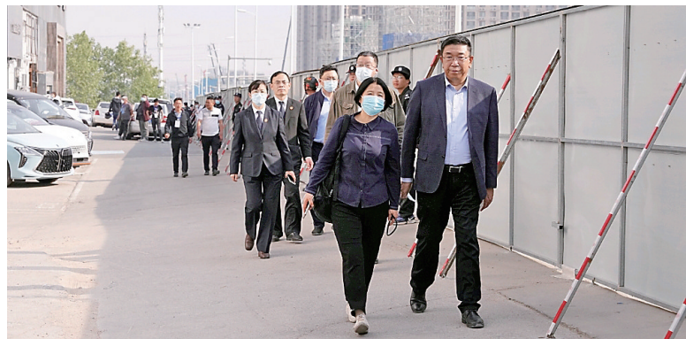
■青岛中院、李沧法院联合开展涉“重庆路快速路项目”强制腾迁行动，助力完善城市交通路网体系。