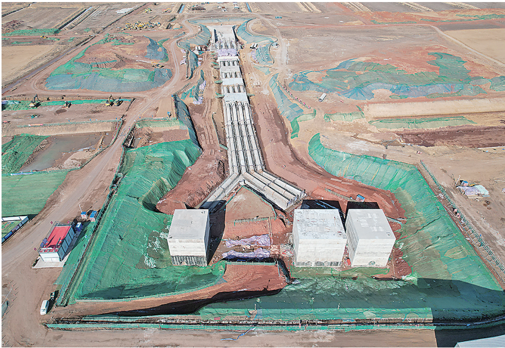
■官路水库青岛出库泵站基础部分施工现场。

2025年官路水库建成蓄水后，将从根本上改变单渠单库的供水局面，与棘洪滩水库一起