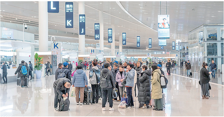
▲春运首日，旅客们在青岛北站排队候车。