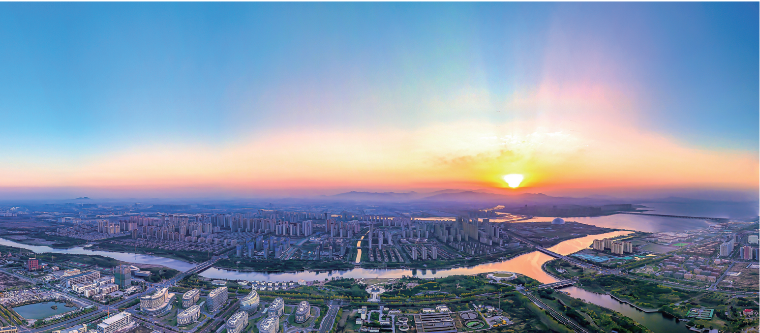
■金茂中欧国际城实景图

2023年,青岛北岸新城发展成就卓著,大放异彩。尤其在文旅方面,成为青岛的高光区域。 方特梦幻王国持续火热,五一期间接待游客5.23万人次,同比增长251.95%;青岛明