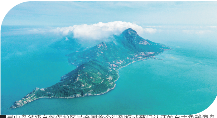
■灵山县省级自然保护区是全国首个得到权威部门认证的自主负碳海岛。

借由高频举办的文旅活动，“时尚青岛”源源不断发出来自大海的邀约，并得到热情回应。电影之都、音乐之岛、博物馆之城……作为国家历史文化名城和中国首批优秀旅游城市，青岛拥有诸多广受认可的城市名片。在旅游品质提升的持续耕耘下，这些名片一张张“活”起来以动态呈现。通过不断拓展文旅发展新空间、塑造文旅发展新优势、实现文旅发展新突破、开创文旅发展新局面，青岛文旅产业必将抵达更美好、更繁华的诗和远方。