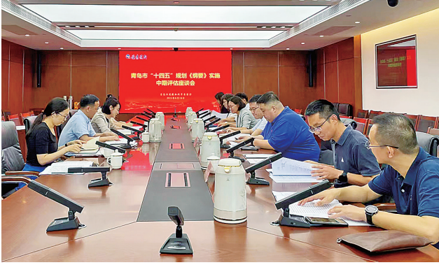
▲市发展改革委召开青岛市“十四五”规划纲要实施中期评估座谈会，听取市人大代表的意见建议。

以三个重要抓手突出监督重点。市人大常委会以“十四五”规划纲要中重大项目、重要指标、重点任务为重要抓手，全面展开对“十四五”规划纲要监督工作。一是专项听取市“十四五”规划纲要中259个重大项目中期进展情况，着重了解纳入国家和省“十四五”规划纲要中的重大项目情况，并根据实际情况，从市级项目库中调出不具备建设条件的6个项目，并从相应领域优选6个新项目补入。二是就规划纲要22项指标完成情况，尤其是个别约束性或重要民生类指标，多次调度政府相关部门研究论证分析，就下一步指标落实提出针对性意见建议，确保合法有序推进指标落地。三是紧紧把握中央、省、市委有关工作部署，对“十四五”规划纲要中有关经济发展、创新驱动、民生福祉、绿色生态、安全保障等重点领域重点任务的进展情况，充分发挥好人大各专委会的专业优势，以41个专项规划实施为依托，深入开展重点任务的监督调研。通过一批专项规划重点任务的突破，发挥关键领域引领带动和薄弱环节补短板作用，推动规划体系高效落地，引领经济社会高质量发展。