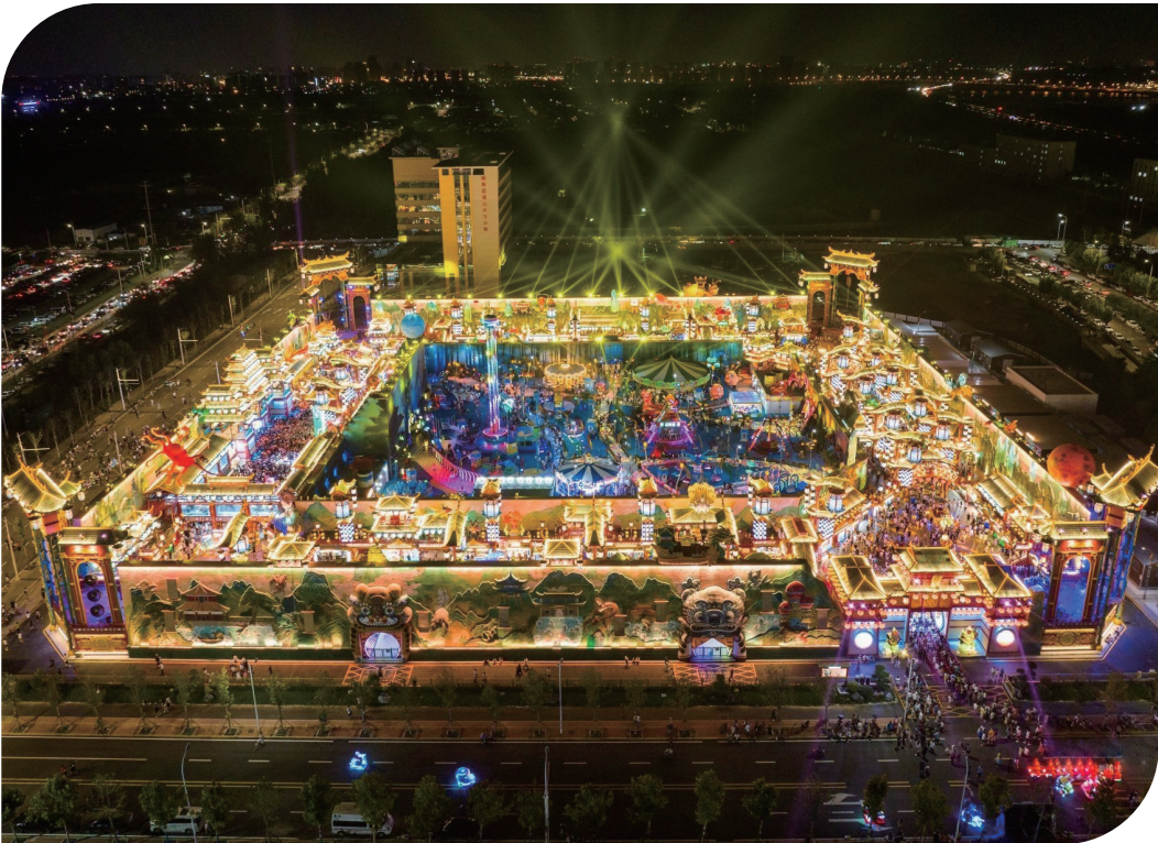
■青岛·明月山海间不夜城已成为青岛市民和外地游客的争相打卡地。

目前，青岛已开通8条海上旅游航线，包括环游浮山湾、奥帆中心至崂山太平、奥帆中心至海底世界、奥帆中心至邮轮母港等热门航线，其中“环游浮山湾”自2018年推出就成为青岛海上旅游航线中的代表。以奥帆中心为起点，以浮山湾为游览线路，与灯光秀融为一体的游览体验，使其成为独具青岛特色的夜经济文旅产品。数据显示，全市2023年海上旅游累计发船超1.1万航次，发送游客超100万人次，营业收入超1.1亿元，超过2020—2022年三年营收总和，