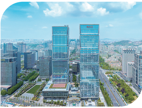
■位于青岛崂山区的钓鱼台酒店和美高梅酒店。

做好“旅游+”文章，实现旅游产品全业态创新，是旅游品质提升攻坚的重要任务。位于莱西市的北京汽车制造博物馆，是青岛首家越野车主题博物馆；位于即墨区的矿晶科技博物馆，旨在打造矿物宝石收藏品类最全、亚洲最大、世