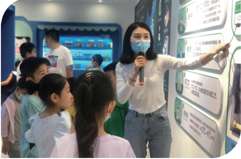
■新希望琴牌“食育乐园透明工厂游”现场。

界一流的矿物宝石博物馆；位于胶州市的新希望琴牌乳业“食育乐园透明工厂游”，探寻一杯好牛奶的生产过程，是大小朋友喜闻乐见的牛奶科普乐趣所在；位于西海岸新区的明月海藻世界，是集智慧工业旅游、康养度假、科普研学、会展会议于一体的文旅综合体项目，先后获批全国科普教育基地、全国海洋意识教育基地，年综合收入超过5亿元。