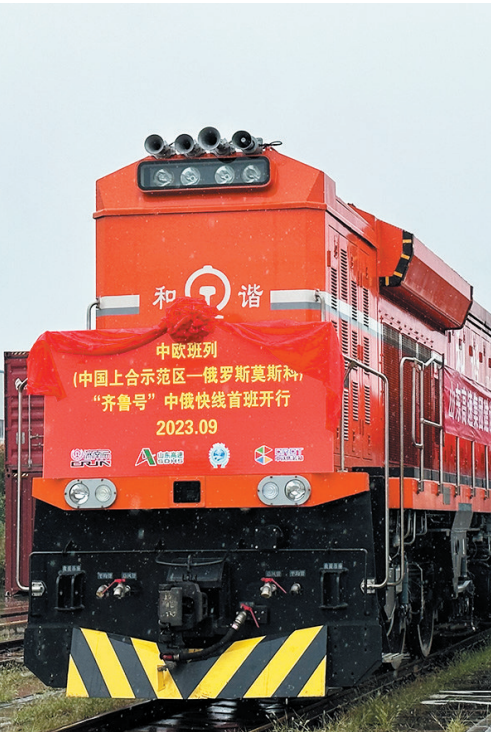
■2023年9月，山东首班中欧班列（齐鲁号）“中俄快线”从上合示范区发出。