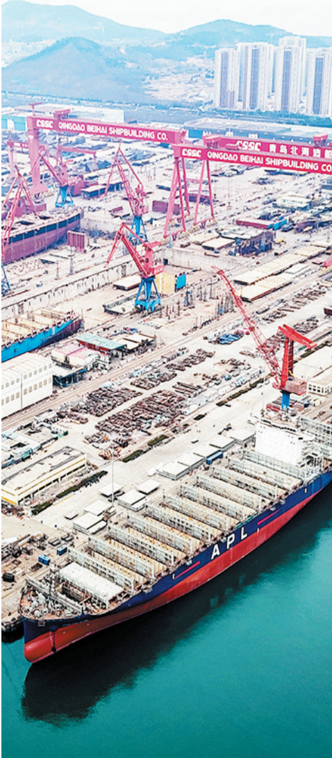
■青岛海西湾船舶海工产业基地，多艘大型船舶正同时开建。