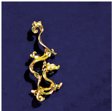
■青岛若七珠宝文化艺术博物馆原创设计的《瑞龙》系列文创。

艺术正为城市带来什么?艺术还能给城市带来什么?发现美之所在,精神之所在,这场寻龙之旅本身,就已足够斑斓动人。而在城市有机更新的语境之下,如何以艺术之力构建城市的未来质感,更为让人期待。