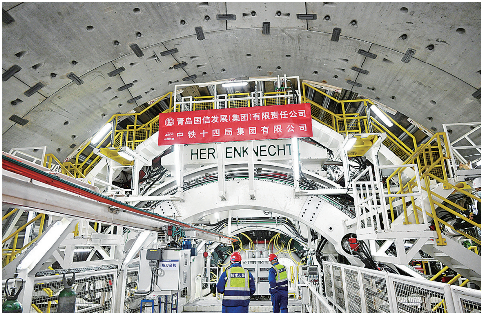
日前，胶州湾第二隧道主线隧道开始盾构掘进。

从项目领域看，重大产业类项目20个，总投资1420.9亿元；民生保障类项目11个，总投资449.6亿元；基础设施类项目11个，总投资2336.2亿元。入选项目涉及新一代信息技术、先进制造、高端化工、新能源、新材料、基础设施、民生等多个领域，体现了投资体量大、产出效益好、引领性强的特点，将对青岛促投资、稳增长提供有力支撑。