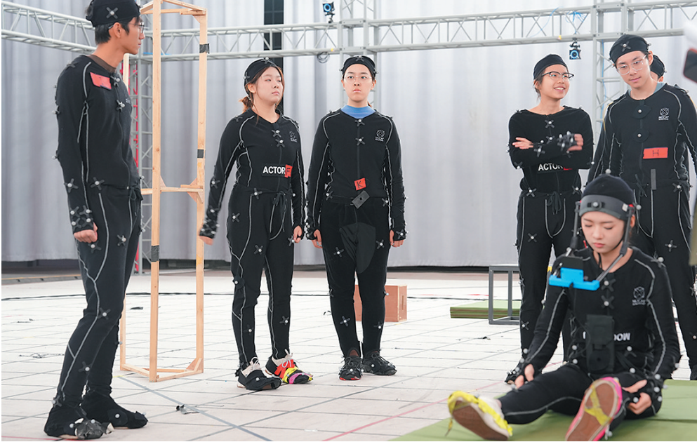
■青岛电影学院学生在东方影都参加虚拟影像实习实训。

新征程中,要展现新作为、拥抱新赛道。虚拟影像产业作为虚拟现实产业的细分领域,具有应用空间大、产业潜力大、技术跨度大的特点,未来大有可为。青岛电影学院是山东省唯一的影视类本科院校,设有虚拟现实技术、影视摄影与制作、表演、动画等相关专业,青岛东方影都产业控股集团是业内公认的中国工业电影生产基地,被誉为“中国科幻大片的摇篮”,双方均致力于推进国际一流的影视虚拟化制作平台和全流程影视后期制作中心建设。应国家、省、市虚拟影像产业发展及黄河文化数字发展战略的迫切需求,应校企深度融合、产教互动培养行业急需的虚拟影像制作高素质应用型人才、服务电影强国战略的需要,双方强强联手、精心筹划打造虚拟影像产业学院。“虚拟影像产业学院将立足青岛影视产业优势,赋能虚拟现实产业发展,满足虚拟影像行业快速发展的需求,推动数字经济转型升级,助力山东省新旧动能转换。”青岛电影学院院长王宏民表示。