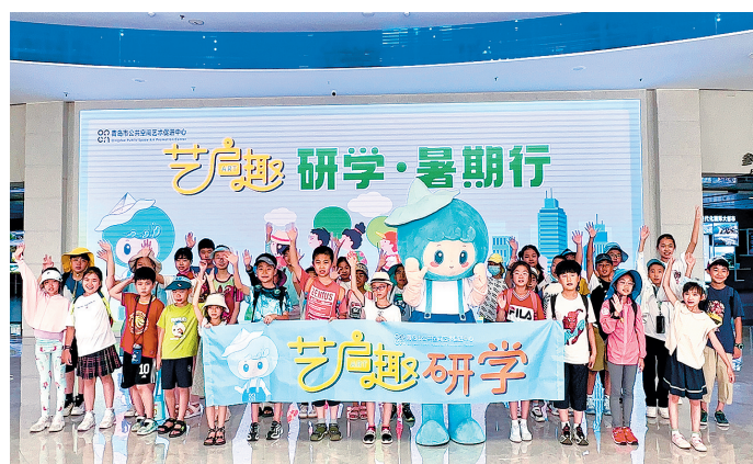
■“艺启趣”研学活动现场。

青岛城市展览馆2012年12月29日面向公众免费开放,2022年完成首次大规模提升改造。2023年,青岛城市展览馆以不断完善的配套功能和公益研学活动,为公众提供丰富多彩的高品质公共文化服务。12月29日,在开馆十一周年之际,自然资源科普展厅开放试运行,为守正创新的航程再添新彩。