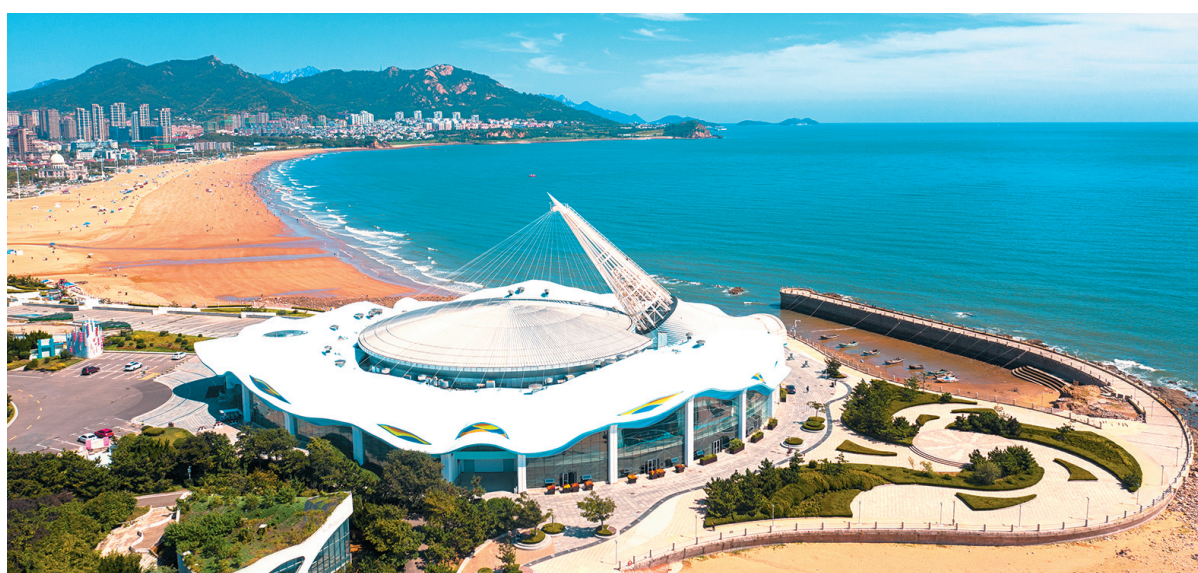
■青岛城市展览馆鸟瞰。

青岛城市展览馆2012年12月29日面向公众免费开放,2022年完成首次大规模提升改造。2023年,青岛城市展览馆以不断完善的配套功能和公益研学活动,为公众提供丰富多彩的高品质公共文化服务。12月29日,在开馆十一周年之际,自然资源科普展厅开放试运行,为守正创新的航程再添新彩。