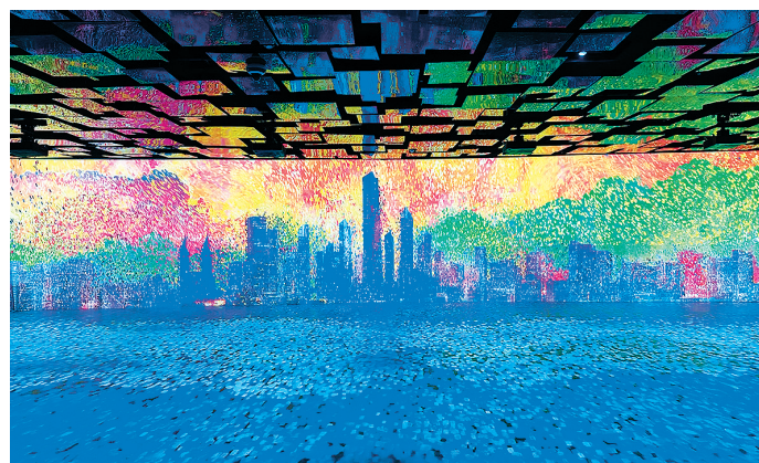
■自然资源科普展厅“绘见青岛”。