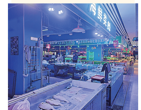
12月16日,西海岸新区安子智慧农贸市场的海鲜区被射灯照成了蓝色。

鲜显得更新鲜。他不知道这样的“白光灯”是否合规,因此专门咨询过市场管理员,但对方也没敢给他打包票。