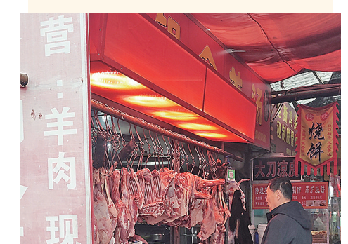
12月14日,崂山区北村早市一家专营羊肉的商户利用红色灯箱投射有色光。