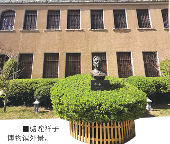
■骆驼祥子博物馆外景。

伦纳德·蒙洛迪诺在《思维简史:从丛林到宇宙》中这样阐述:“使人类有别于其他动物的地方在于,人类是唯一一种能够利用过去的知识和创新去创造的动物。”作为高度结合的多层次文化空间集群,文博区的特点各有千秋,又集中和利用博物馆、艺术馆、美术馆等公共文化机构的群集效应,打造与生活高度结合的多层次文化空间集群,形成魅力翩跹的个性化文化片区。这些被称作高级“奢侈品”的文化资源,相互渗透、叠加,馆际之间形成一种集聚的文化合力,不受季节、冷暖等物理时空的影响,成功带动周边产业的发展,促进了文化消费,锻造了区域文化品牌,成为当下文旅唱响“四季歌”的引擎之作。