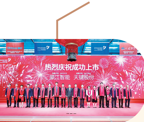
■豪江智能科技股份有限公司在深交所挂牌。