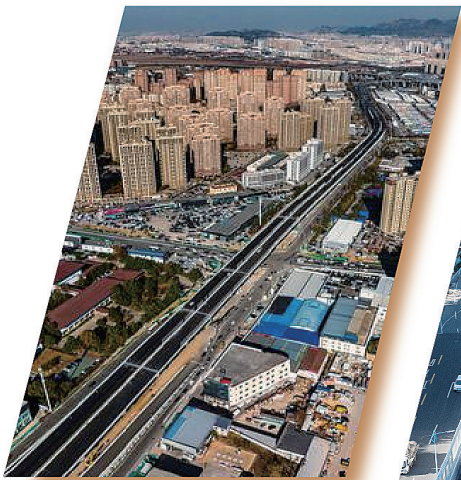
■重庆路快速路建设现场，平整黝黑的沥青路面宽阔舒展。