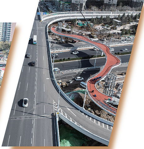
■金家岭立交工程主线桥已经通车，地下停车场即将完工。

涵盖清洁取暖“煤改气”、供热、环卫、水务、综合管廊等多个方面，到本月底建成投用13个项目，加速构建“系统完备、高效实用、智能绿色、安全可靠”的公用设施体系