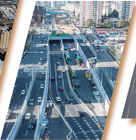
■辽阳路快速路地道北半幅已封顶，将于本月底提前通车。