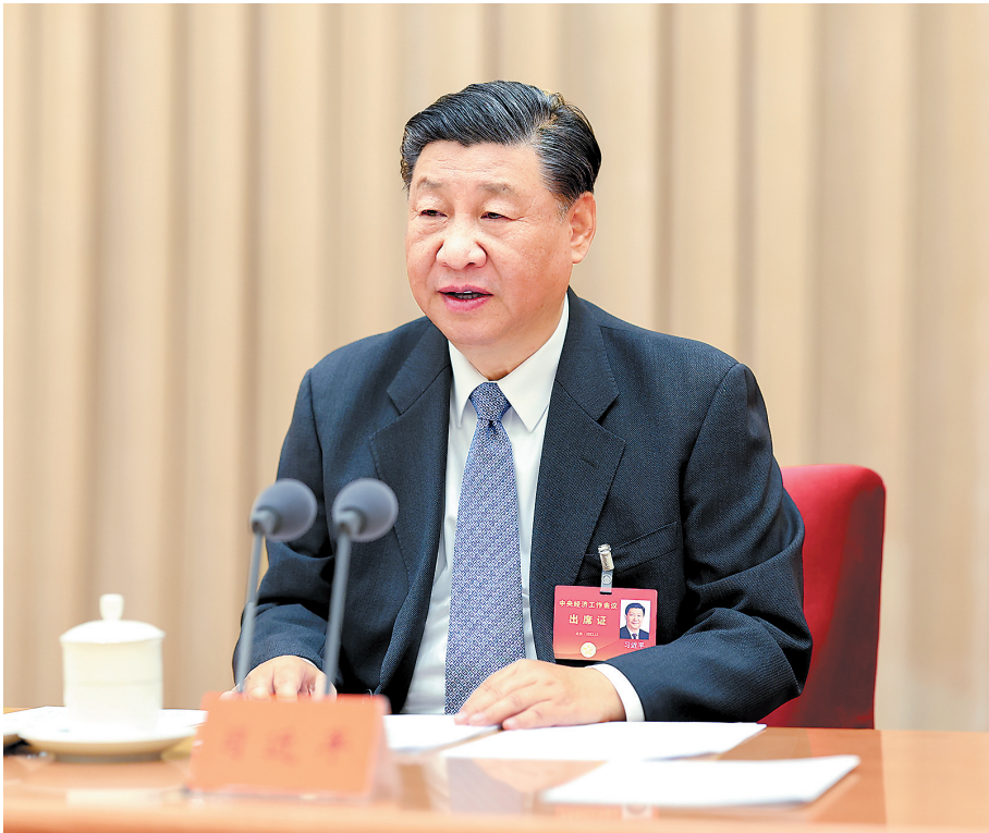
12月11日至12日,中央经济工作会议在北京举行。中共中央总书记、国家主席、中央军委主席习近平出席会议并发表重要讲话。