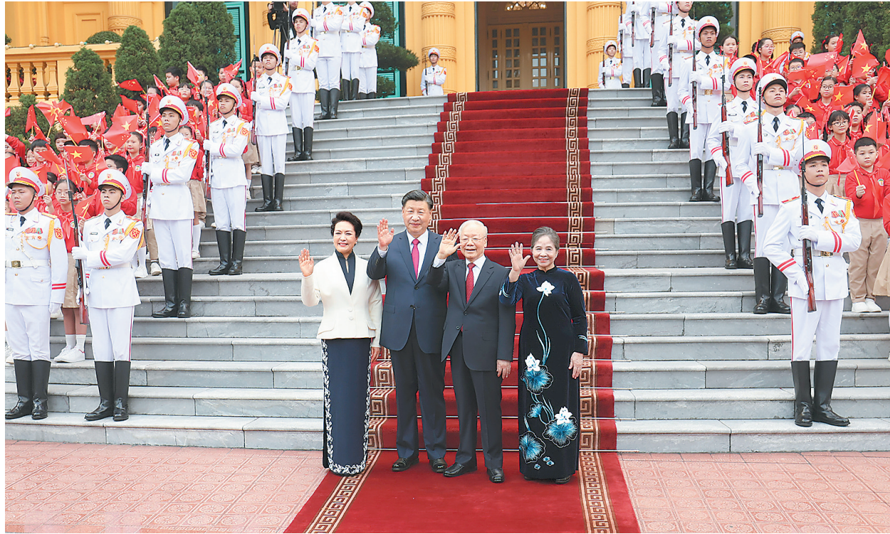
当地时间12月12日下午,刚刚抵达河内的中共中央总书记、国家主席习近平在越共中央驻地同越共中央总书记阮富仲举行会谈。这是阮富仲在主席府广场为习近平举行隆重欢迎仪式。

新华社河内12月12日电(记者倪四义 汪金福 陶军)当地时间12月12日下午,刚刚抵达河内的中共中央总书记、国家主席习近平在越共中央驻地同越共中央总书记阮富仲举行会谈。双方宣布中越两党两国关系新定位,在深化中越全面战略合作伙伴关系基础上,携手构建具有战略意义的中越命运共同体。