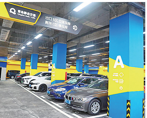
■新建停车场解决了居民的停车难题。

队，建立“慢病规范诊疗中心”，开通青大附院“知名专家号源直挂”服务，深化健康管理举措，家庭医生签约29.88万人，签约率达61.16%。 “主动服务”在老旧小区改造工作中表现更为突出。2023年，市南区老旧小区改造计划涉