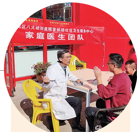
■家庭医生团队走进八大峡街道观音峡路社区。

“最近，我发现徐州路上新建了一处养老中心，看上去很漂亮，不知道可以提供哪些服务？”“近期流感严重，去医院就诊的人多，请问社区卫生服务中心能不能打针？能不能自己带药？”在市南区香港中路街道五四广场社区，居民们你一言我一语，诉说着心中的“急难愁盼”问题，拉开了市南区“暖南惠民 向您报告 听您建议”活动的序幕。 自11月21日起，市南区启动“暖南惠民 向您报告 听您建议”活动，组建由区委书记、区长、副区长和民生领域部门主要负责人为队长的11支小分队，分阶段走进全区11个街道，加强与社区居民的沟通交流，在基层一线寻访群众的“揪心事、烦心事”，听取群众的意见建议，解决群众实际困难，切实提高社区居民的获得感、幸福感，向全区人民交上满意答卷。