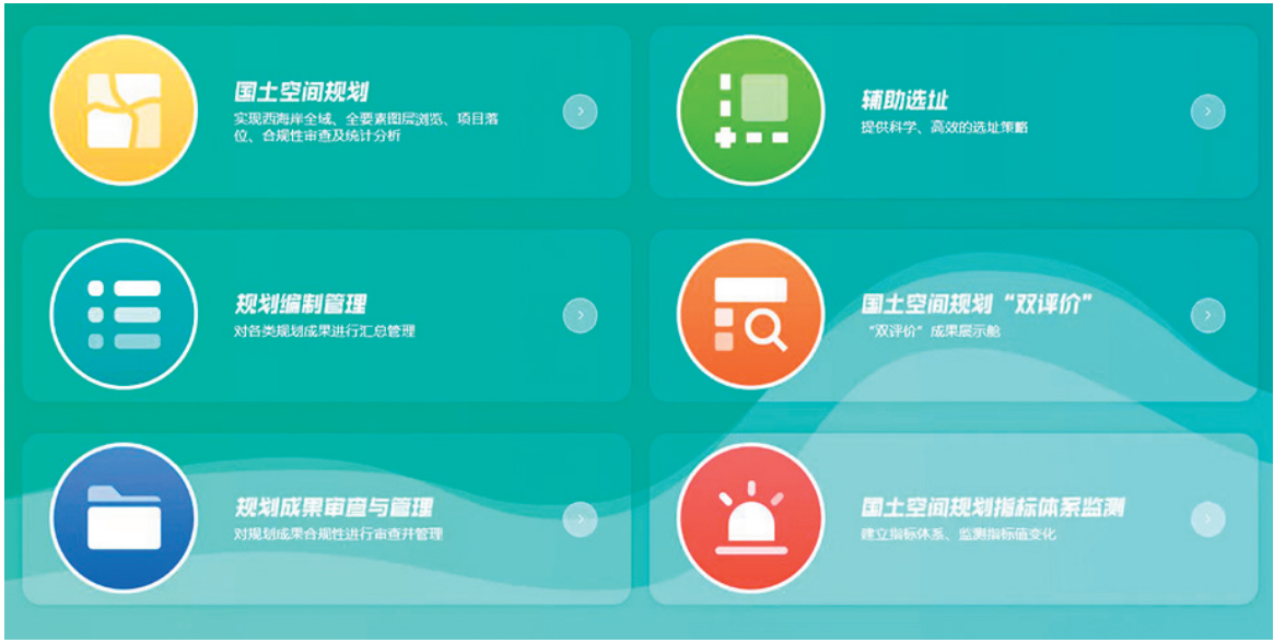
■西海岸新区国土空间一张图系统数据信息平台。