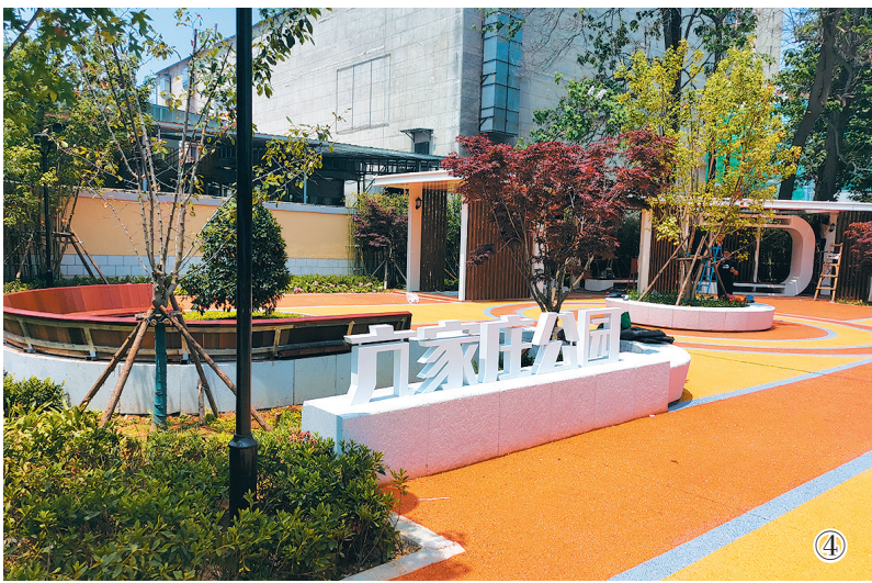
▲图③④为泰州路片区整治建成后。