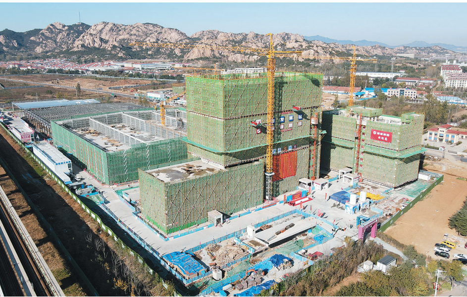
■建设中的中国科学院金属所高端轴承青岛示范基地项目。

2023年，西海岸新区被评为全国首批自然资源节约集约示范县，为全市唯一。并在全省自然资源开发利用暨自然资源节约集约示范县授牌工作会议和全国自然资源节约集约理论与业务培训班(第4期)上作典型发言。