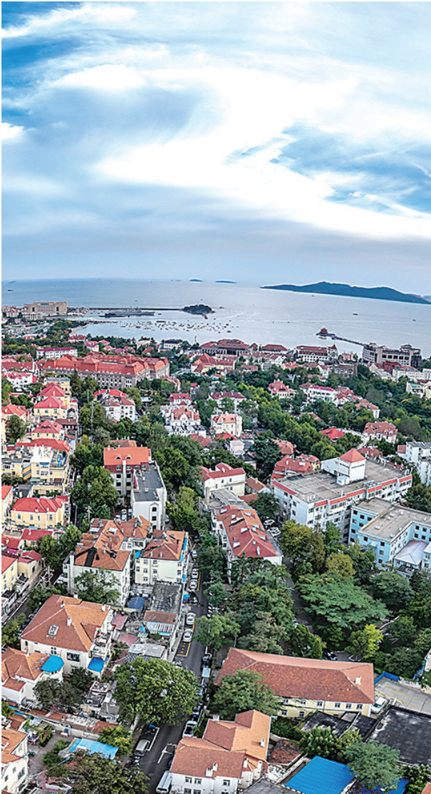
■青岛老城区红瓦绿树、碧海蓝天。

12月5日下午,在市政府新闻办召开的新闻发布会上,市生态环境局、市发展改革委、市园林和林业局对《规划纲要》展开解读。五年之后、十年之后,青岛将呈现怎样的新图景?透过这份规划建设思路,一幅更加清晰的美丽青岛建设图景铺陈开来——基于“山海岛城湾、田园林水乡”交融共生的生态城市基底,谋定打造绿色低碳发展先行之城、碧海蓝天环境品质之城、共享自然生态和谐之城、同美普惠宜居典范之城等八大重点战略任务,聚力打造山海风韵、魅力宜居、活力善治的美丽青岛。到2035年,人与自然和谐共生的美丽青岛全面建成。