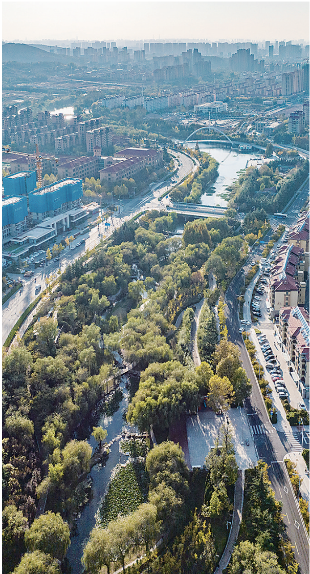
■经过多年治理的李村河如同一条碧带绕城而来。