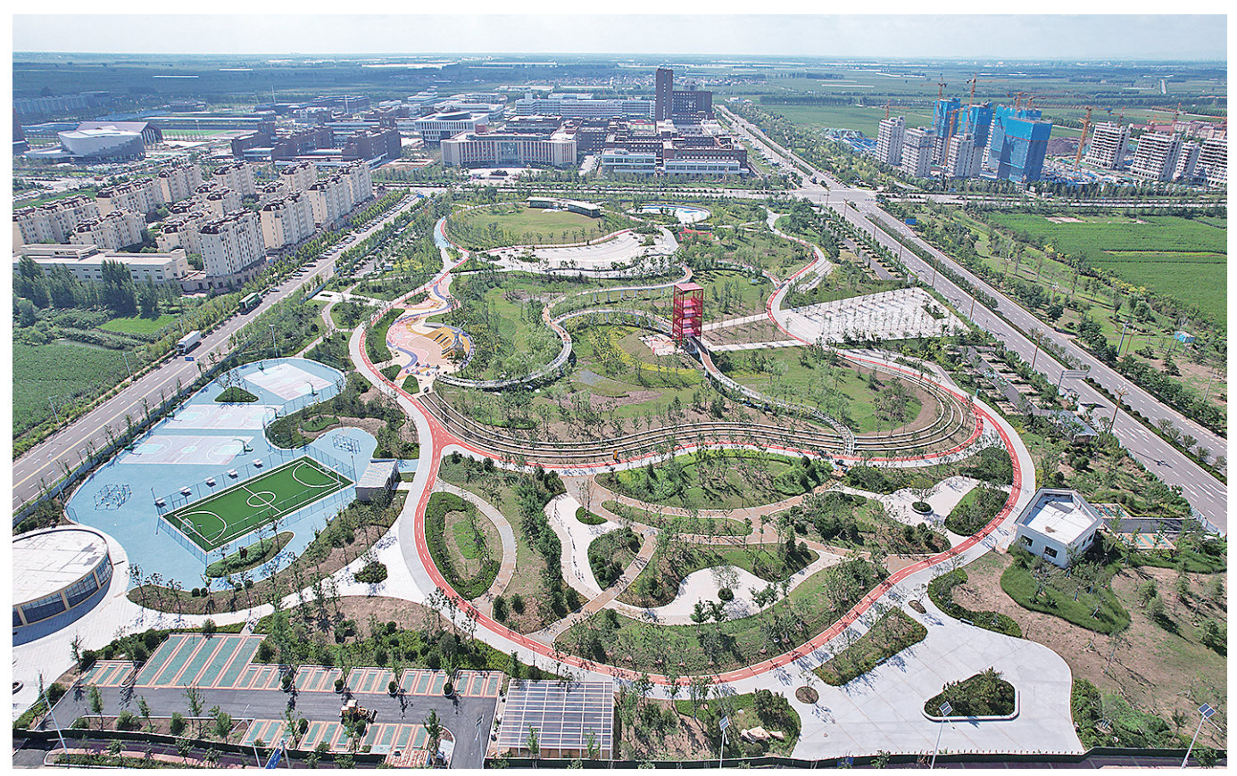
■环境优美、配套设施完善的姜山新城公园。

夜幕降临，位于姜山新村的振兴街人车来往，周边工厂下班的工人、附近的村民纷纷走进夜市，品味人间烟火。蘸满酱汁的铁板鱿鱼，外酥里嫩的灌汁臭豆腐，开胃解腻的酸辣无骨鸡爪、冰冰甜甜的椰子汁……在这条被誉为青岛首条“村级步行街”上，到处升腾着满满的烟火气。这是“突破姜山”的一个精致缩影。