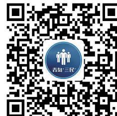
扫描二维码,提交意见建议。

同日,“三民”活动平台在青岛政务网上线,网上意见建议征集专栏同步开通,市民可以通过电脑登录青岛政务网“三民”活动平台专题页面或手机扫描二维码进入征集界面,提交意见建议,时间截止到最后一场“云述职”结束。