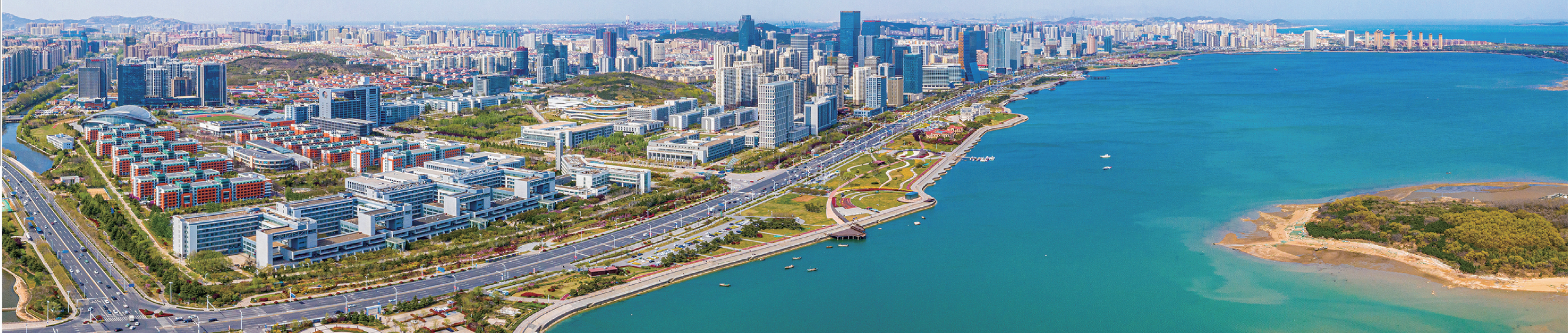
■青岛西海岸新区唐岛湾风光旖旎。