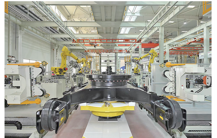
■潍柴(青岛)智慧重工智能制造中心项目在青岛西海岸新区正式投产。