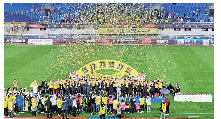
■青岛西海岸足球队“冲超”成功。