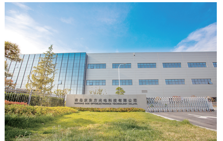
■青岛京东方光电科技有限公司。