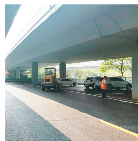
■海尔路立交桥下空间变身公共停车位。