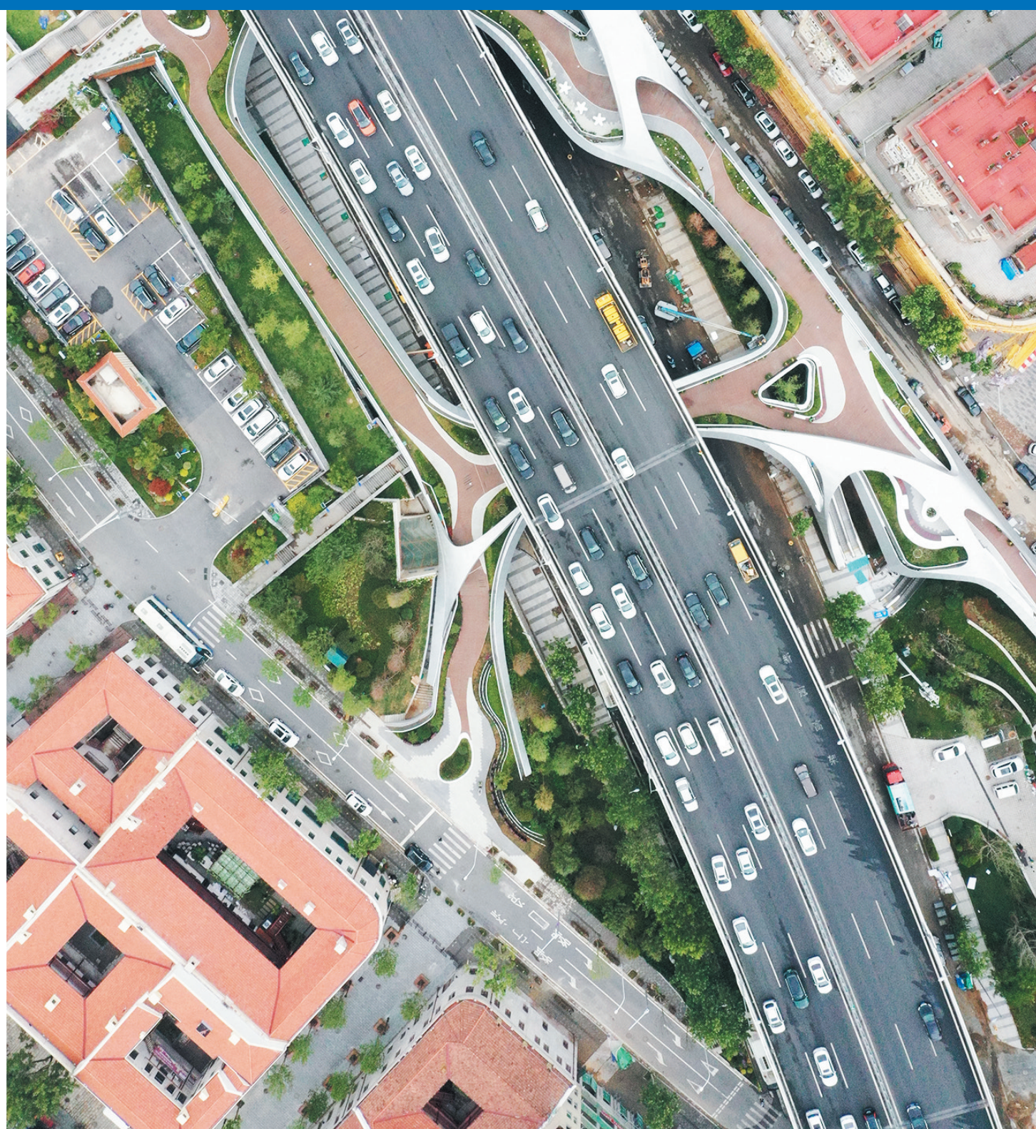
■浮岛公园利用桥下空间将人行、车行系统有机融合。

每到周末,BERRY BEANS咖啡馆里便人潮涌动。人们在沿途欣赏太平山中央公园美景的同时,也找到了一处休闲放松的地方。现在,该咖啡馆已经成为太平山中央公园新晋的“打卡地”,山海一体的自然景观里多了一份文化与时尚气息。