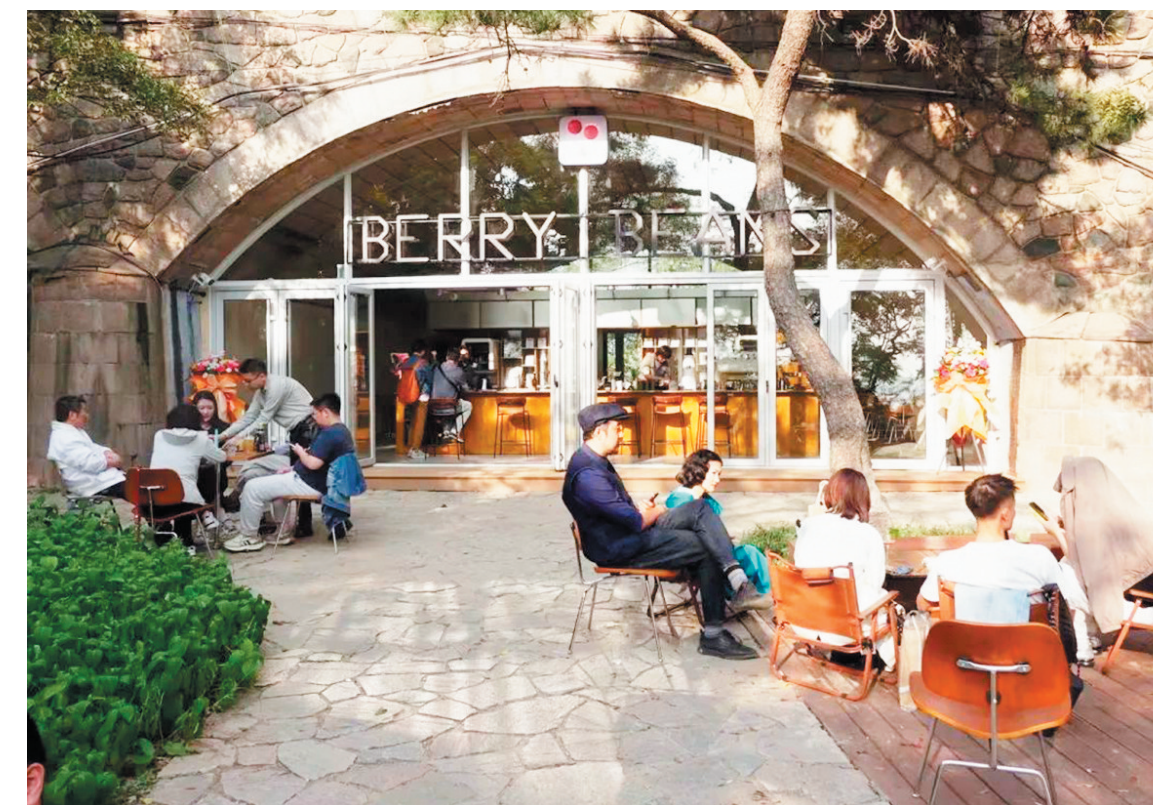
■位于太平山中央公园一处桥洞下的咖啡馆,有着浓郁的时尚文化气息。