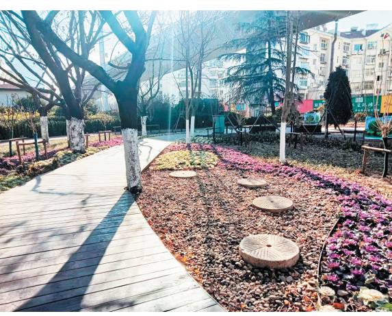
■位于胶宁高架路下的大尧一路口袋公园。