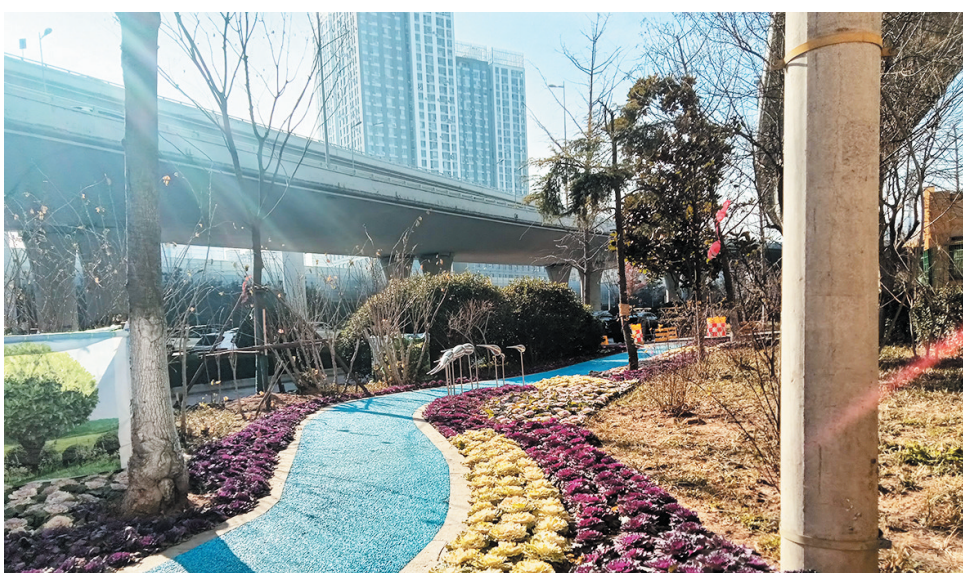
■位于新冠高架路下的莘县路口袋公园。