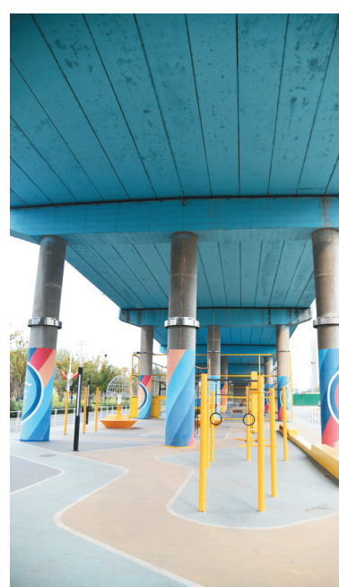
■胶州市扬州路桥下空间被改造为活动场地。刘栋 摄