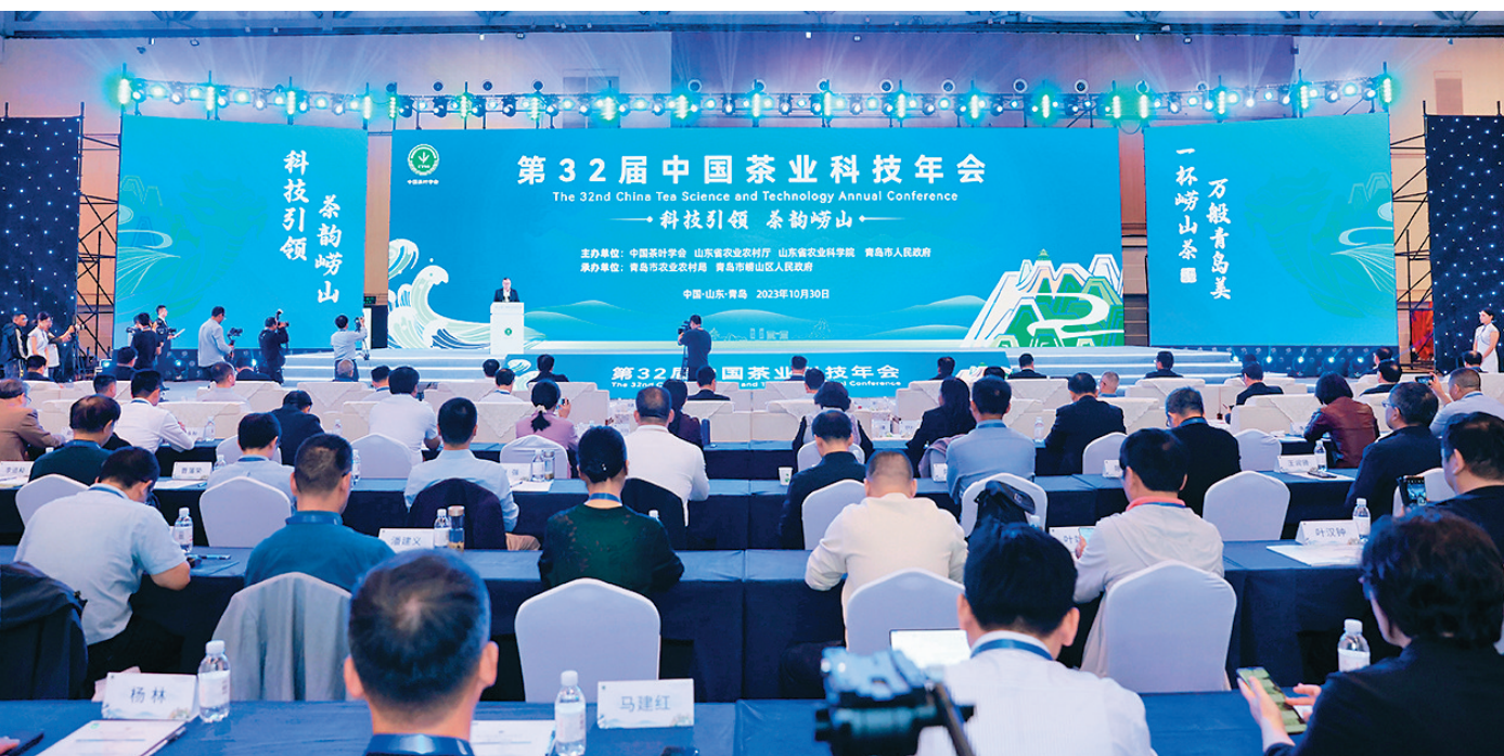
■第32届中国茶业科技年会嘉宾云集。