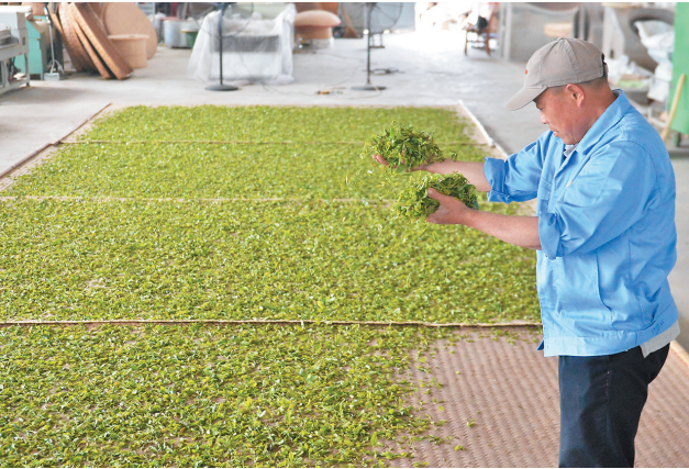
■在北崂茶园,茶农摊晾鲜叶制作小兰花白茶。

把“金名片”擦得更亮,崂山区通过茶文化的传播与交流,让“一杯崂山茶,万般青岛美”定位声名远扬。本届年会,行业协会搭台、业界大咖“唱戏”,除开幕式环节外,还设置了山海茶韵观摩路线,多方位、多角度、多层次展示山、海、城、茶、田相融合的发展之路,向与会嘉宾全面展示崂山茶文化、茶产