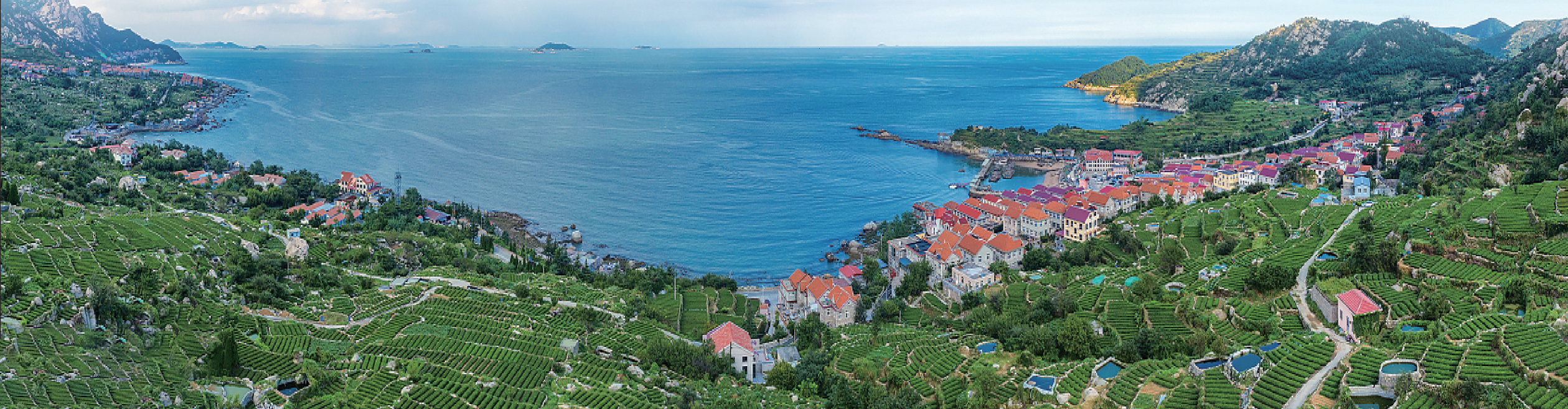
■山、海、城、茶、田于一体的优美风光。