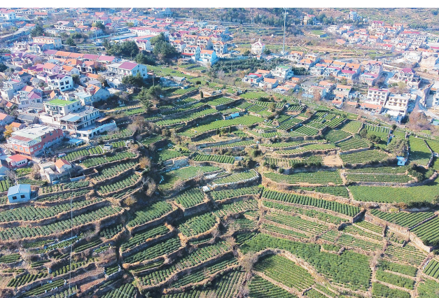
■返岭社区茶园错落有致。

区也因茶荣获国家农产品质量安全县、“百县、百茶、百人”茶产业助力乡村振兴先进典型等40多项省级及以上荣誉。