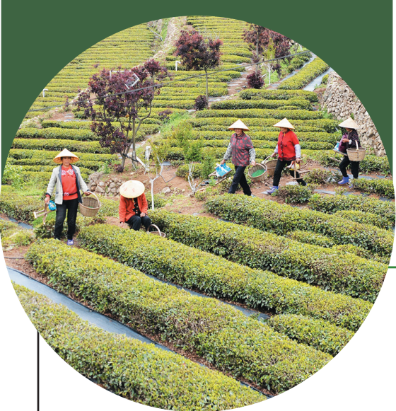
■“五一”过后,崂山茶集中上市。(资料照片) 邢志峰 摄

一杯崂山茶,万般青岛美。在崂山区,一幅以茶产业振兴绘就的幸福生活新画卷正徐徐铺展。