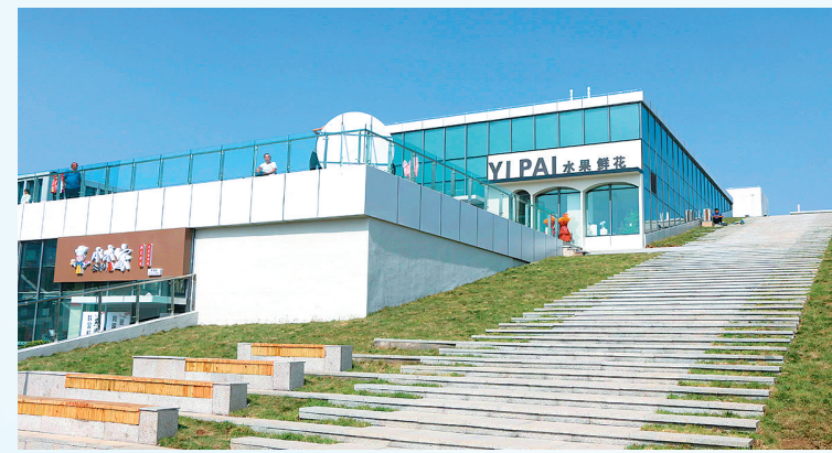
■空港食集外景。

记者了解到，该项目于今年6月10日开工，7月17日钢结构主体封顶，9月28日正式运营，从开工到运营用时110天，创出了“临空速