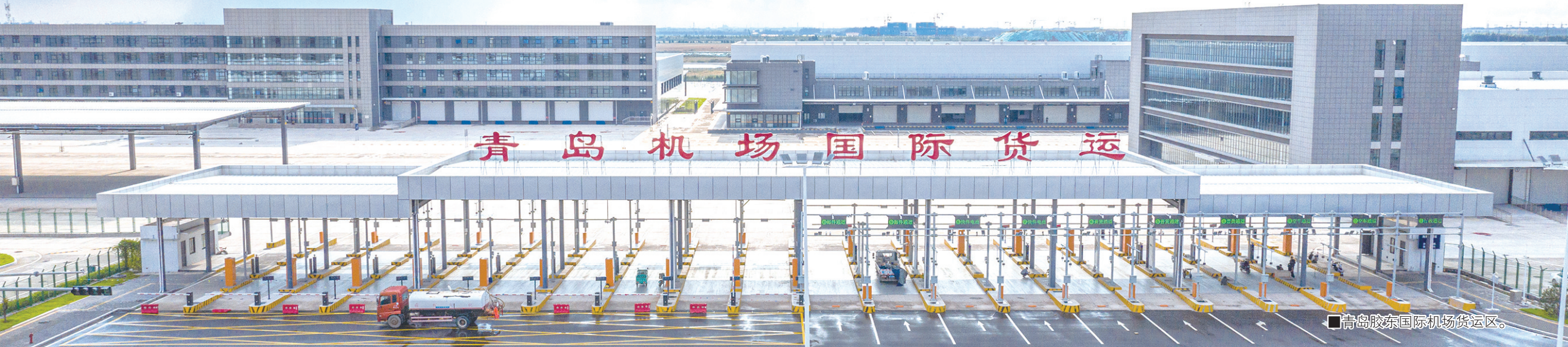
■青岛胶东国际机场货运区。

为实现从“网红”到“长红”，空港食集还将通过举办龙虾节、上合空港国际美食节、航食