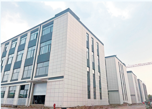
■青岛佳海临空产业园。

记者从青岛胶东临空经济示范区获悉，近日，青岛佳海临空产业园一期19栋单体建筑外立面已经完工，目前正在进行室外道路铺设、绿化等工作，预计项目将于11月底前交付使用，全部运营后将有近200家企业入驻。